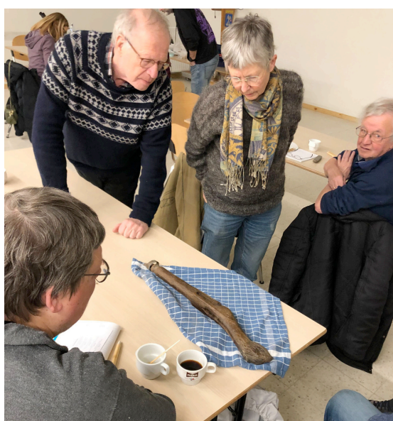
De deelnemers van de workshop 'Hoe verpak en bewaar je metaalvondsten' op zaterdag 3 februari bekijken elkaars vondsten.