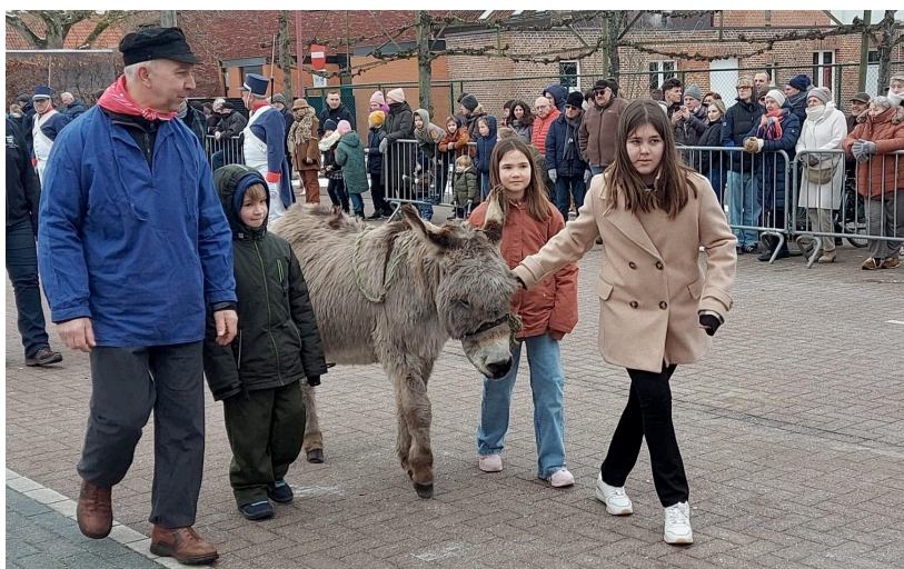
De bewoners van Bel vierden op zaterdag 21 januari Sint-Antonius, oftewel het Toontjesfeest.