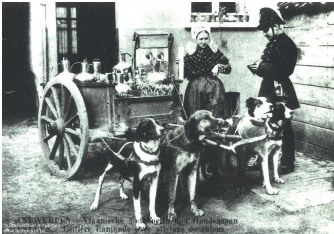
Melkboerin met hondenkar wordt geverbaliseerd wegens het ontbreken van muilbanden, 1895.