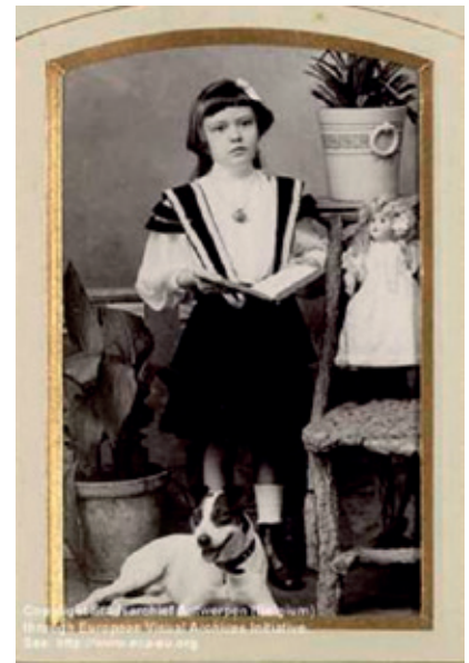
Portret van een meisje met kamerplanten, een pop, boek en hond (1891). De aanwezigheid van de hond samen met de andere voorwerpen op het portret toont aan dat hij deel is van het huishouden.

Ook in het woordgebruik werd in het begin van de twintigste eeuw een sterker onderscheid gemaakt. Zo ontstond de term straathond als tegen-