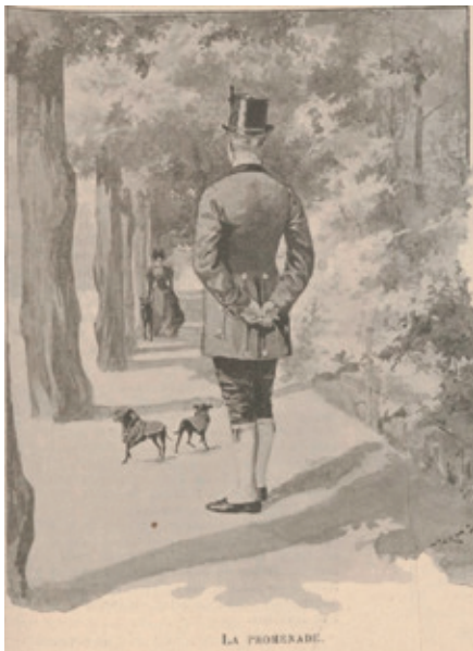
Honden zorgden mee voor sociale interactie en trokken de aandacht op de wandelingen van de burgerij.

hunne honden naar het slachthuis brengen, waar zij allen bij middel van verdrinking gedood worden. Arme honden! En mogen wij het geen harteloze lieden heeten, die, liever dan eenige franken per jaar te betalen, deze dieren, welke hun zoo gehecht waren, laten slachtoffers zonder medelijden? 71