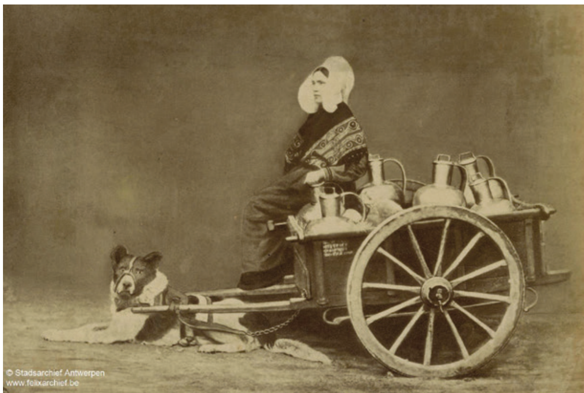
Hond met muilband rust uit voor zijn melkkar ca.1860. Het verdwijnen van de hondenkar in de twintigste eeuw door technologische vooruitgang zorgde ervoor dat de hond in het straatbeeld enkel een huisdier werd.