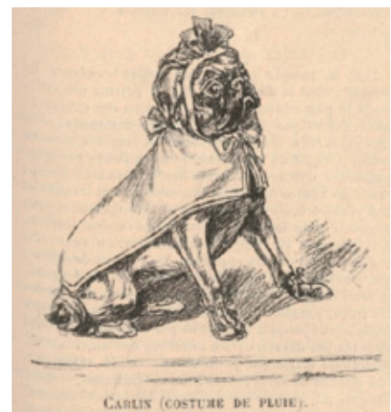
Honden werden vervreemd van hun natuurlijk uiterlijk en vermenschlijkt. Bron: Le monde illustré, le tailleur pour les chiens, 15-08-1896, 105.