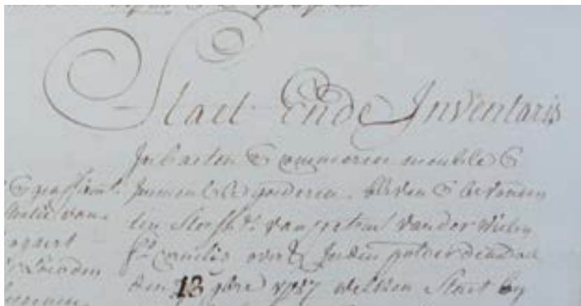
Figuur 1: 'Staat ende inventaris in baeten ende commeren meuble ende immeuble goederen bleven ende bevonden ten sterfhuise van petrus van der wielen filius cornelis overlenden in den polder den doel den 13 septembre 1787'. Bron: rijksarchief Gent, Schepenbank Kieldrecht-Doel, 792.

In het bestek van deze studie kan onmogelijk de hele wooncultuur onderzocht worden. Net zoals in heel wat andere studies wordt daarom gefocust op enkele 'verklikkers', een set van materiële spullen die een bijzondere betekenis hadden voor de ontwikkeling van de materiële wooncultuur. In dit artikel wordt gefocust op de verhouding tussen tinnen en aardewerken servies, de aanwezigheid van schouwklenden en de verspreiding van de warme drankcultuur. Terwijl die eerste objecten kenmerkend zijn voor het toenemende comfort in het vroegmoderne huisraad, zijn kopjes, ketels en lepels voor koffie, thee of chocolade illustratief voor het verspreiden van nieuwe koloniale producten in de woningen van rurale gezinnen. Hiervoor maken we gebruik van enkele honderden boedels. Van de 300 onderzochte Aalsterse boedels waren ongeveer twee op drie geschikt voor een analyse van het huisraad tussen 1650 en 1800. In Doel was dit voor slechts 66 van de 411 boedels het geval. 14