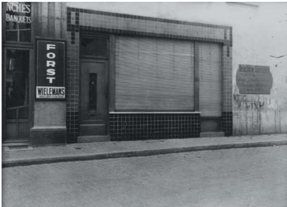
Net als na de bevrijding werden de gevels van collaborateurs tijdens de bezetting beklad, zoals hier in de Marollen in het voorjaar van 1942

bestrafning van collaborateurs politieke afrekeningen waren. Het slachtofferschap van collaborateurs staat dan ook centraal. 2