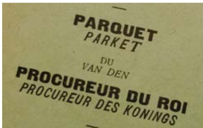
Omslag van een dossier van het parket van de procureur des Konings van Brussel (Rijksarchief Brussel, PK Brussel)