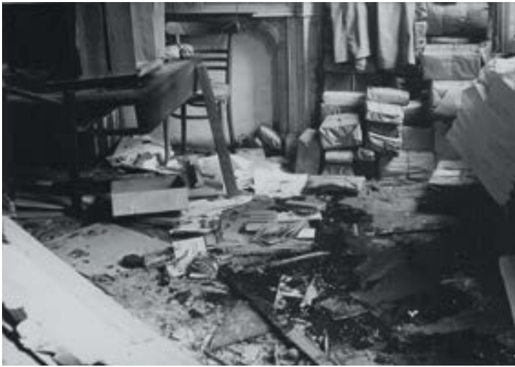
Niet alleen na, maar ook tijdens de bezetting waren collaborateurs doelwit van aanvallen. Tijdens een bomaanslag op een lokaal van Rex in de Brusselse Zuidstraat kwam in 1941 de secretaris van de beweging om het leven. (Rijksarchief Brussel, archief gerechtelijke politie bij het parket van de procureur des Konings van Brussel, inv. nr. 4980, dossier 17)