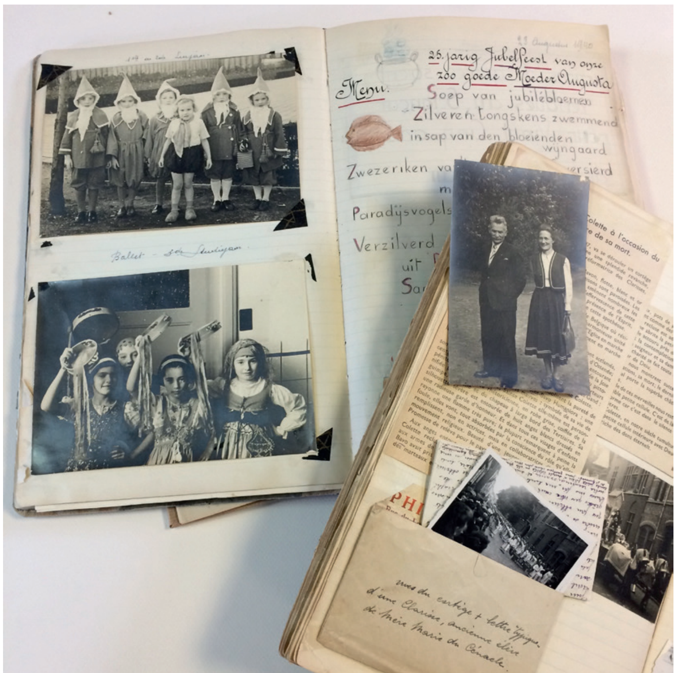
Enkele bladzijden uit de weelderige kronieken van Sint-Bavo te Gent. Op de foto rechts zien we schrijver Stijn Streuvels met zijn dochter Dina "Pruiske" Lateur, leerkracht op Sint-Bavo.