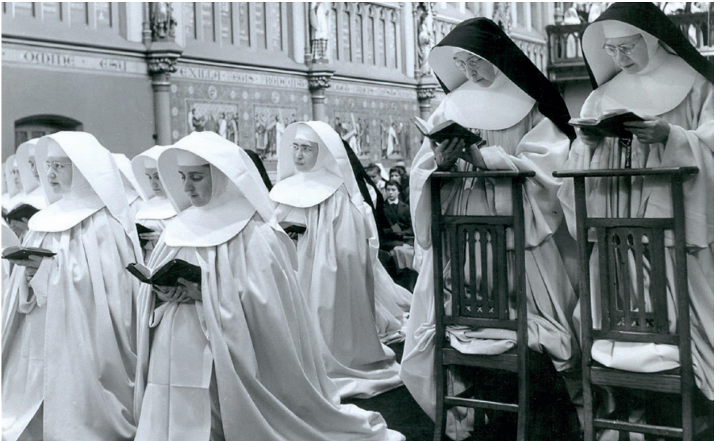
Professie van kandidaat-zusters in de kapel van het Gentse moederklooster, 1953. Op hun hoogtepunt in de jaren vijftig telden de Zusters van Liefde JM wereldwijd 2000 leden. In die periode meldden zich tot drie keer per jaar 25 à 30 jonge vrouwen aan voor het noviciaat.