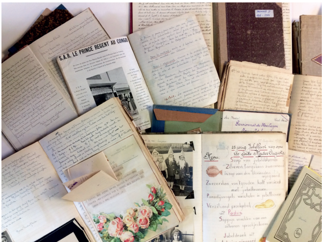
Dagboeken van verschillende kloostergemeenschappen van de Zusters van Liefde JM die in het Erfgoedhuis worden bewaard.

Hoewel ze verplicht waren, verschillen de kloostermemorials onderling enorm, zowel fysiek als inhoudelijk. Terwijl de overste-directrice van het psychiatrisch "vrouwengesticht" Beau Vallon in Saint-Servais bij Namen haar kronieken bijvoorbeeld bijhield in grote statige registers, is het dagboekje van de oudste Congolese missiepost van de zusters in Moanda grotendeels met potlood neergekrabbeld in een fragiel schriftje.