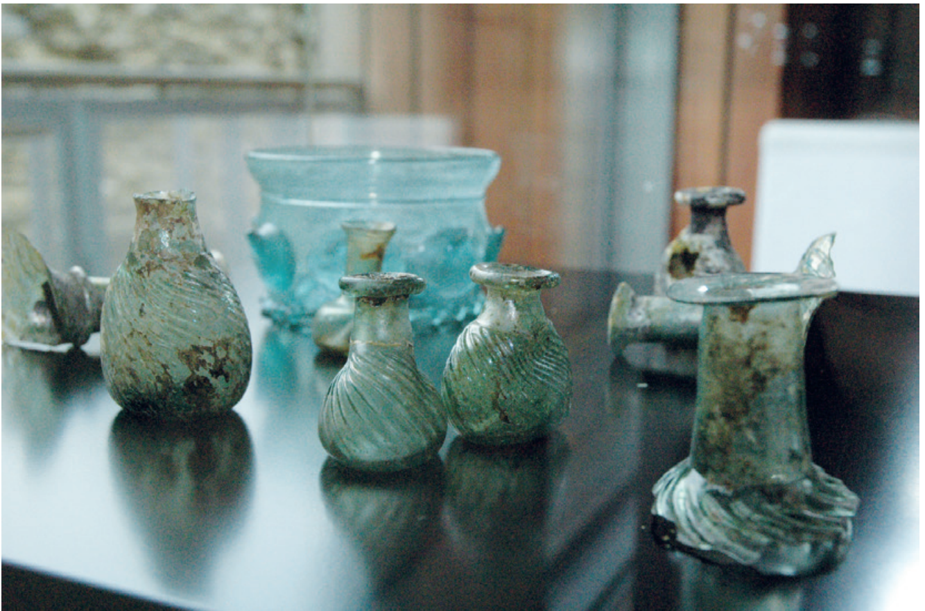
Een aantal opgeknapte parfumesjes met op de achtergrond een koolstronk.