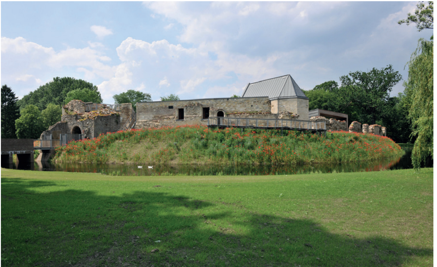
Zicht op de Waterburcht Pietersheim, waar in de beerput achter de paardenstallen de vondsten werden opgegraven.