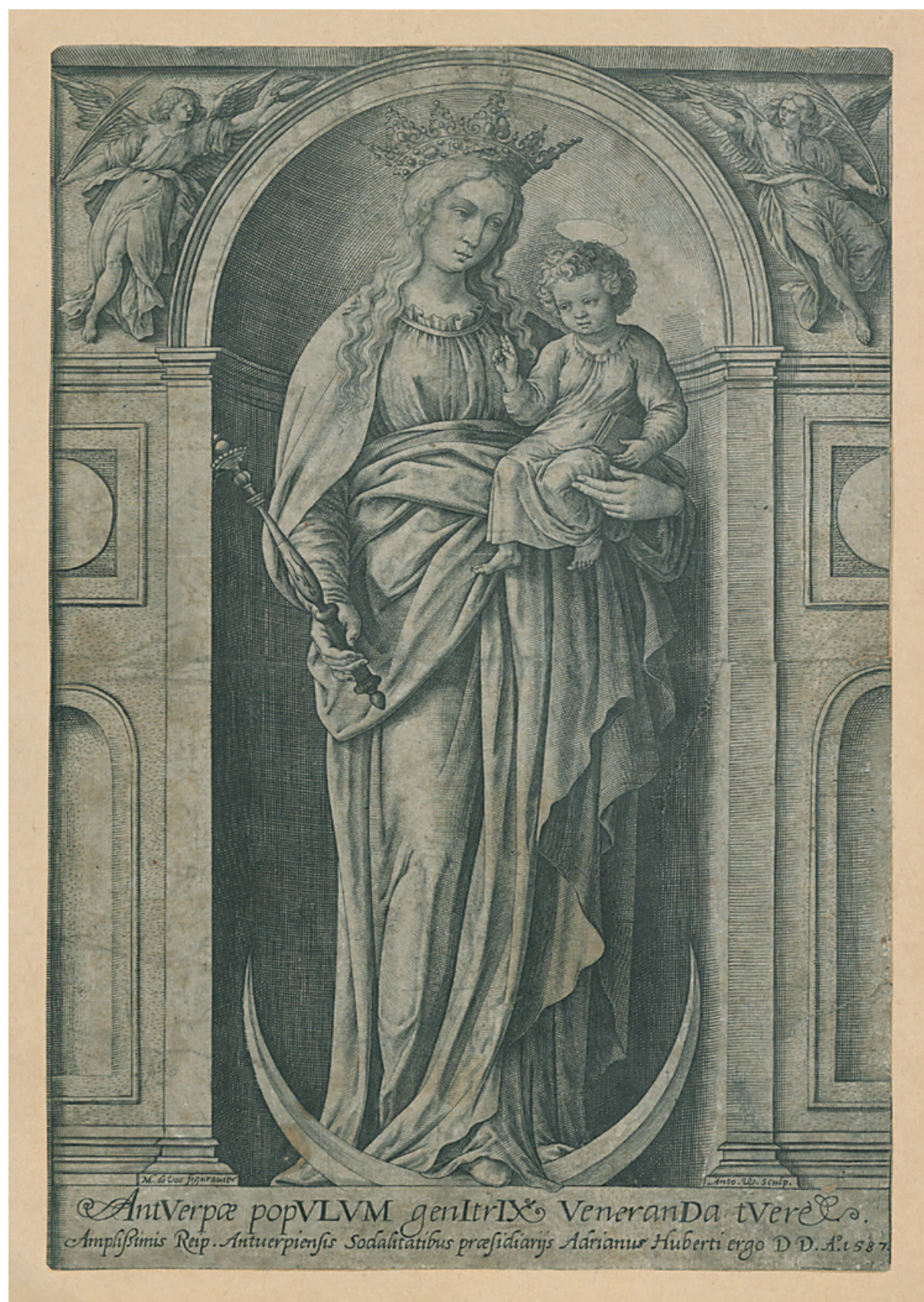
Het Onze-Lieve-Vrouwebeeld van het Stadhuis te Antwerpen. Gravure van Anthonius Wierix, uitgeven door Adrianus Huberti. (UA, Collectie Thijs, nr. 1000)