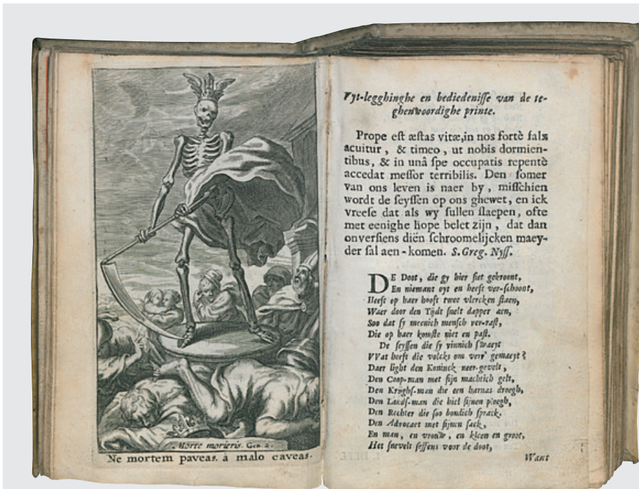
W. Stanihurst, vertaald en voorzien van prenten en poëzie door [A. Poirter], Nieuwe afbeeldinghe van de vier uitersten . Antwerpen, Cornelis Woons, 1662, katern 2*1v-2*2r. (Collectie RG 3046 D)