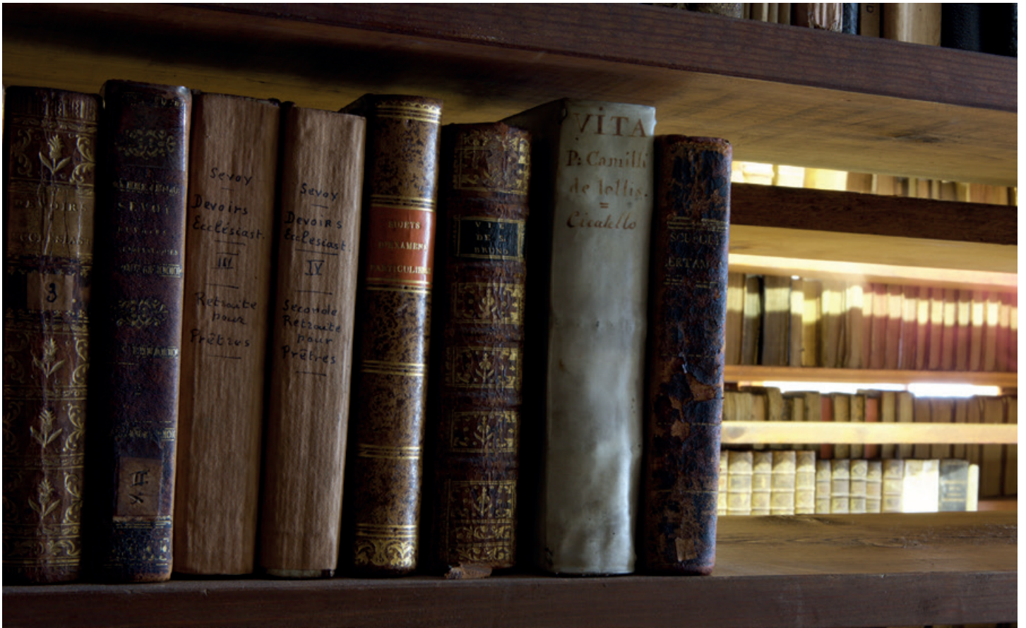
Beeld van het magazijn van het Ruusbroecgenootschap.