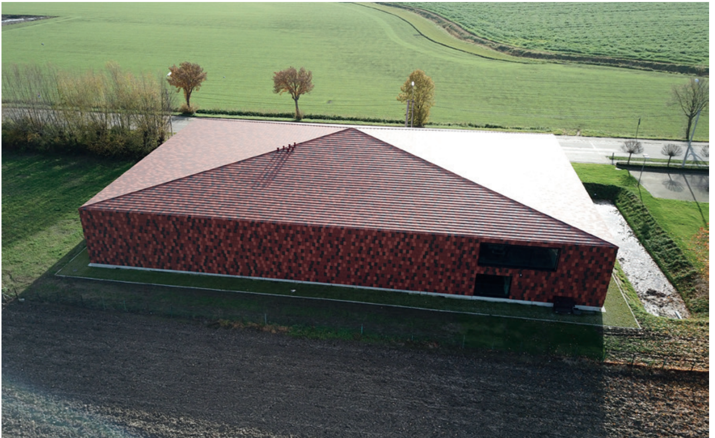
Luchtfoto van het Regionaal Erfgoeddepot Potyze.