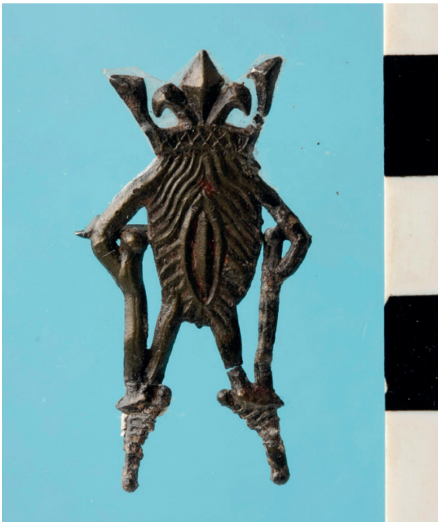
Lood-tin insigne van een vulva op stelten. (Collectie Agentschap Onroerend Erfgoed)