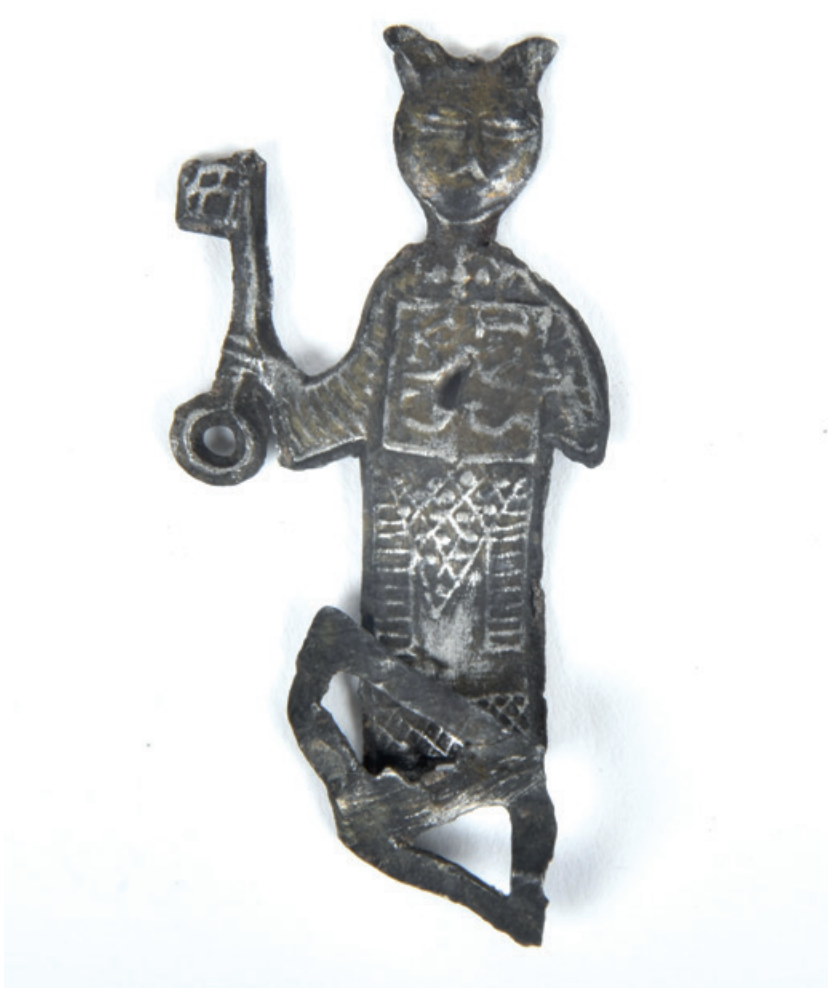
Lood-tin insigne van een kat met in haar linkerhand een boek en in haar rechterhand een sleutel.

ruimte gewijd aan het middeleeuwse verleden van de stad, waarbij 250 insignes in een dertiental thema's aan het publiek getoond worden. De insigne van een gekroonde kat, die in haar rechterhand een sleutel en in haar linkerhand een boek vast heeft, is voor Ieper, als kattenstad, een uitzonderlijk stuk.