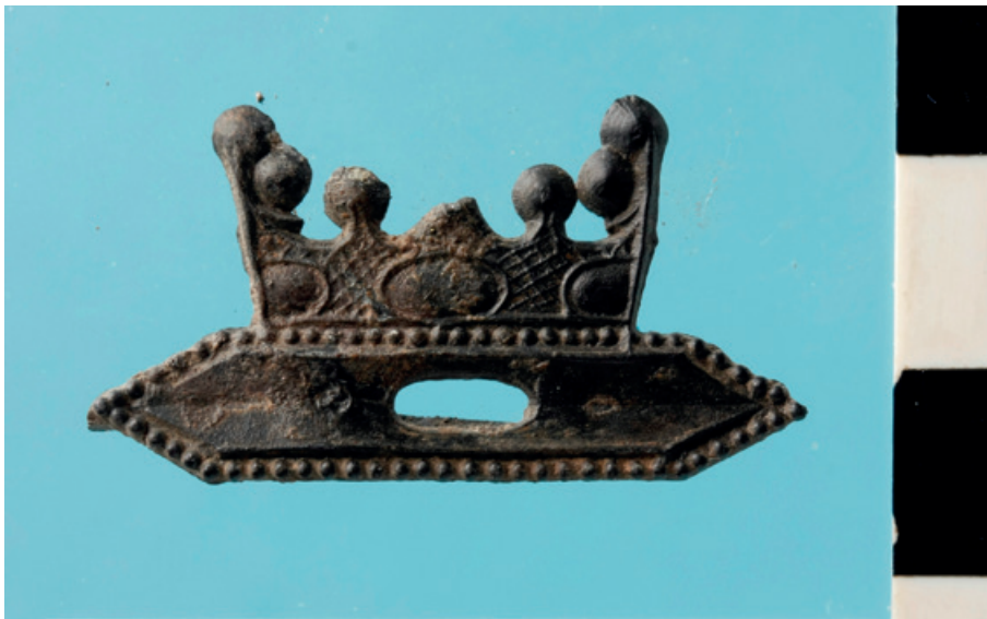
Lood-tin insigne van een gekroonde weefspoel.