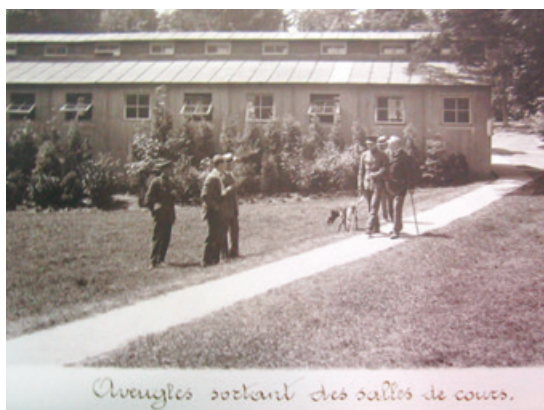
Blinden verlaten de leszaal.

De beeldvorming van de heropvoeding van oorlogsblinde soldaten – net zoals van oorlogsverminkten in het algemeen – moet dus duidelijk in perspectief worden gesteld. Foto's zoals deze in de bundel Une promenade dans l'institut , waarop men oorlogsblinden opnieuw zelfstandig ziet leren wandelen, zullen dan ook eerder uitdrukking hebben gegeven aan de droom van rehabilitatie dan dat ze de werkelijkheid van de blinden in de tussenoorlogse periode voorspelden.