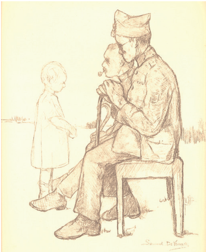
Schets 8 uit Samuel De Vriendt's Schetsen: La toute petite amie/Het vriendinnetje/Making friends (Privé-collectie Pieter Verstraete).

bewaard in het Koninklijk Legermuseum kan echter ook worden afgeleid dat de oorlogsblinden niet echt geneigd waren om zich te laten heropvoeden en er zich overgaven aan neerslachtigheid. 39