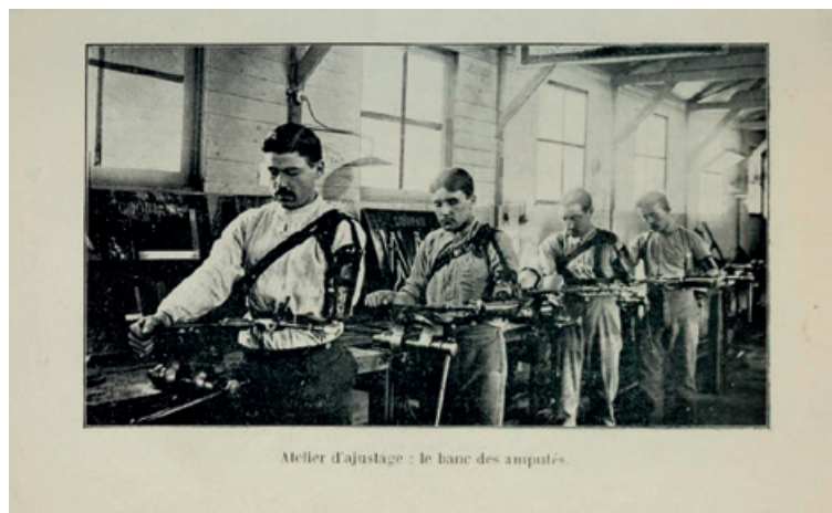
Invaliden met een arbeidsprothese in een werkplaats voor paswerk (atelier d'ajustage) te Port-Villez. Illustratie uit 'La Rééducation Professionnelle des Soldats Mutilés et Estropiés' van Leon de Paeuw, 1917.

Dans la plupart des cas, il sera infiniment préférable de rééduquer l'homme tel qu'il est avec ce qu'il lui reste de membres et de lui choisir une profession qu'il peut exercer sans trop de difficulté dans l'état où il se trouve. 22