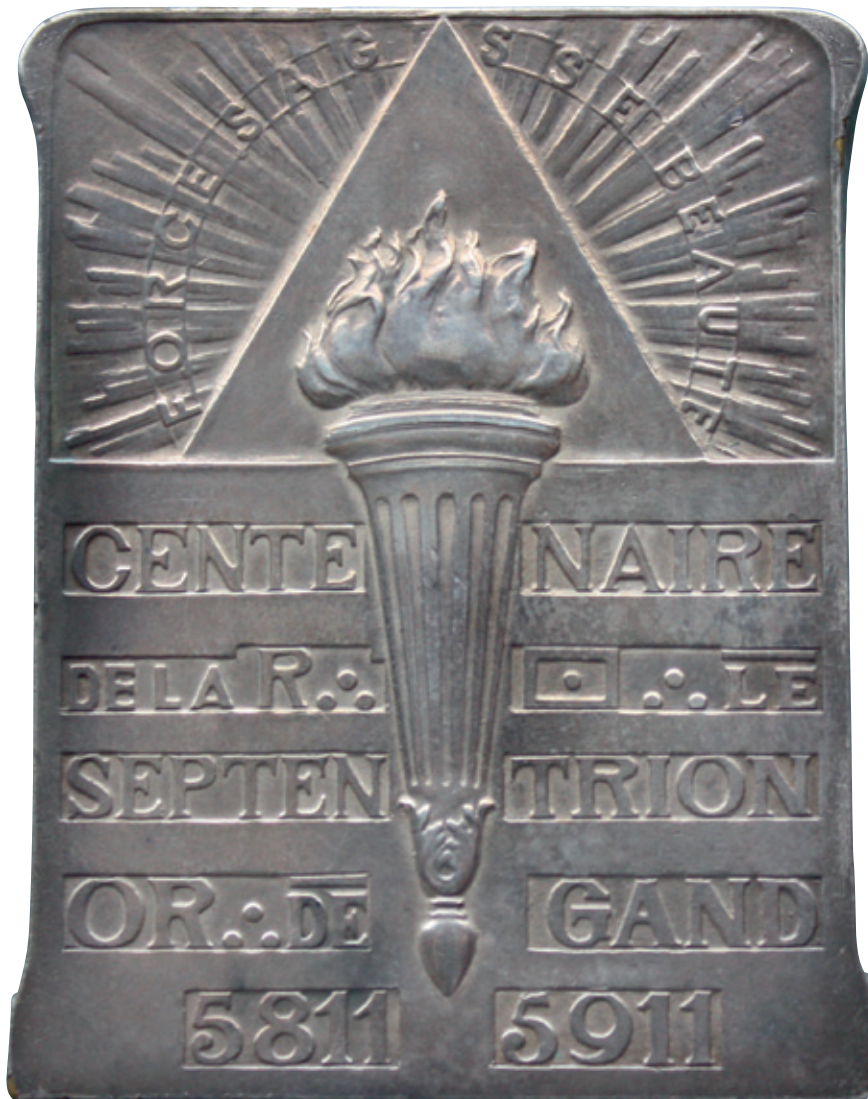
Jubileumpenning van Le Septentrion (Gent), 1911 (Privécollectie Berend Bunk).