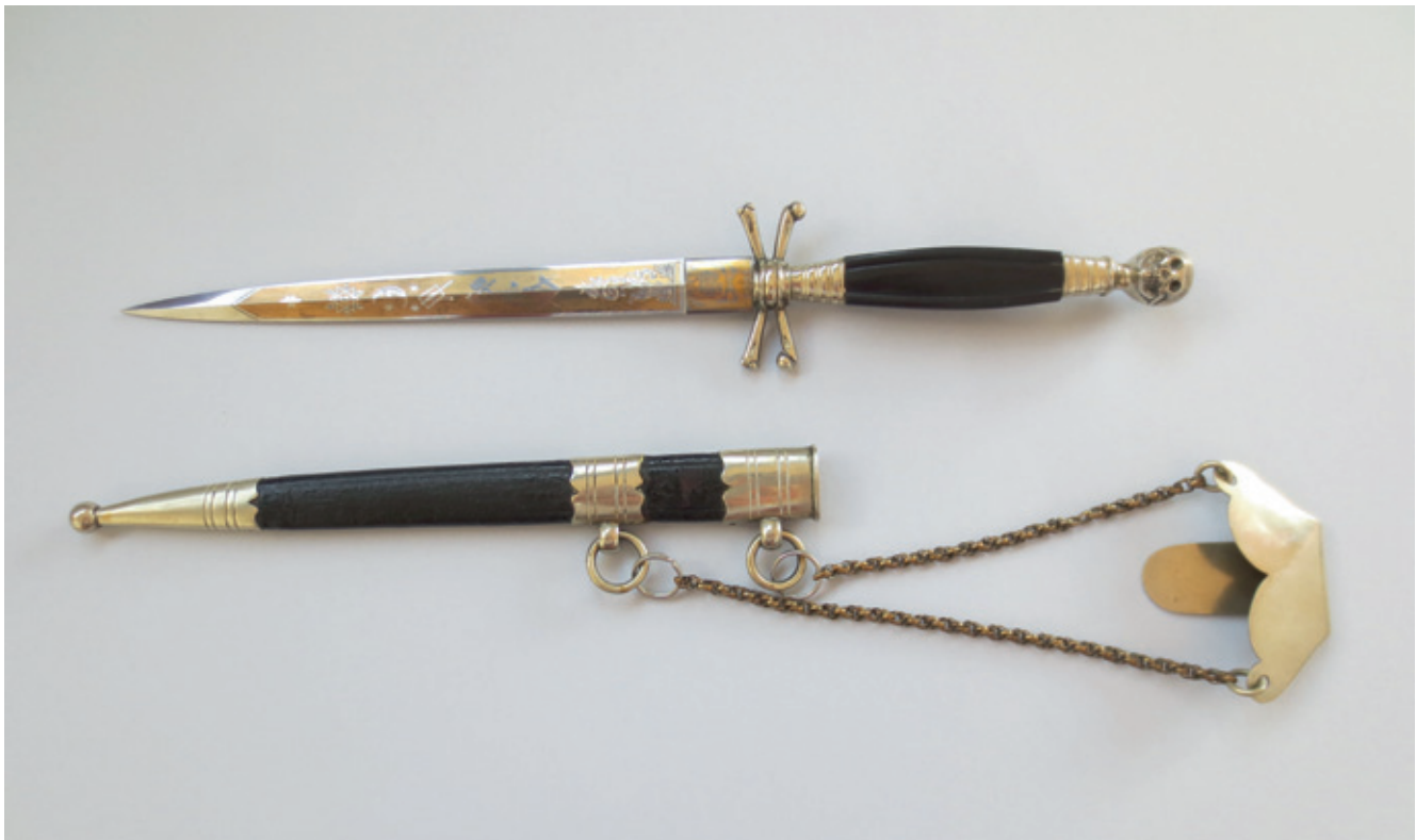
Maçonnieke dolk, tweede helft negentiende eeuw (Privécollectie Berend Bunk).

Welbekend is vooral de oplichterij van Léo Taxil aan het einde van de negentiende eeuw, waar zelfs het Vaticaan in tuimelde: ook in Taxils boeken werd het satanische vooropgesteld als het ware fundament van de maçonnerie. 11 Dat dit in de eerste decennia van de negentiende eeuw ook al leefde, dat de lagere clerus in dat verhaal meestapte en de gelovigen errond kon mobiliseren, daar waren niet zoveel indicaties van bekend. Er waren toen wel al publicaties die de loges een duivelse of demonische natuur aanwreven: de geschriften van de abbé Fiard waren sprekende voorbeelden van het genre. 12 Klaarblijkelijk waren die representaties wel degelijk doorgesijpeld, niet alleen naar mainstream katholieke publicisten, 13 maar evenzeer naar het gewone kerkvolk. Dit zal wellicht helpen verklaren waarom dergelijke satanische elementen diep waren doorgedrongen in volksverhalen allerhande: die vormden ongetwijfeld een spiegel van dieperliggende voorstellingswerelden, zeker in rurale gebieden. 14 De beslotenheid van de maçonnieke werking en haar ongewone symboliek leken bij velen een diffuse angst te genereren. 15 Soms leidde die dus ook tot meer gewelddadige uitbarstingen.