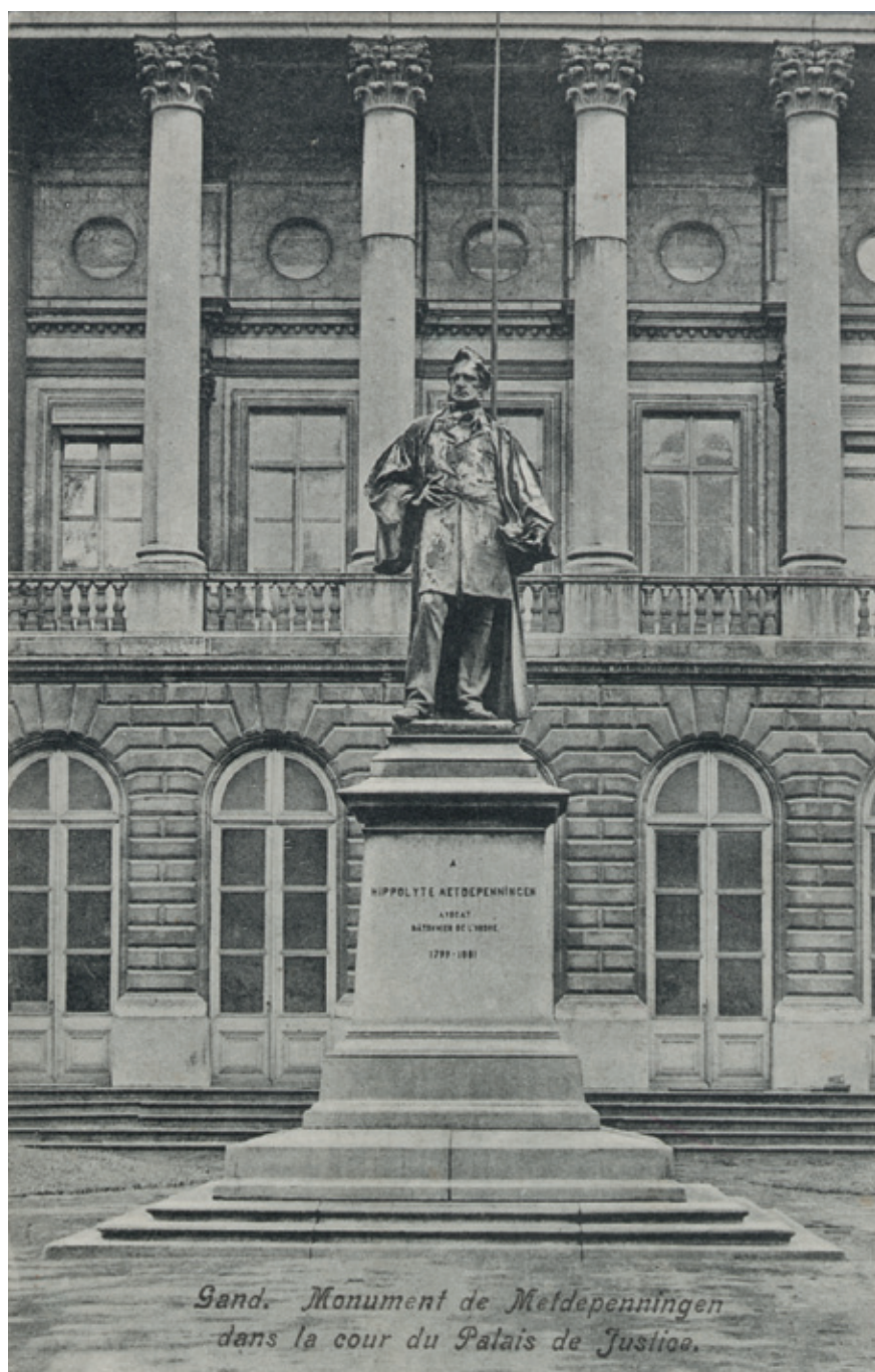
Monument Hippolyte Metdepenningen te Gent, 1886.