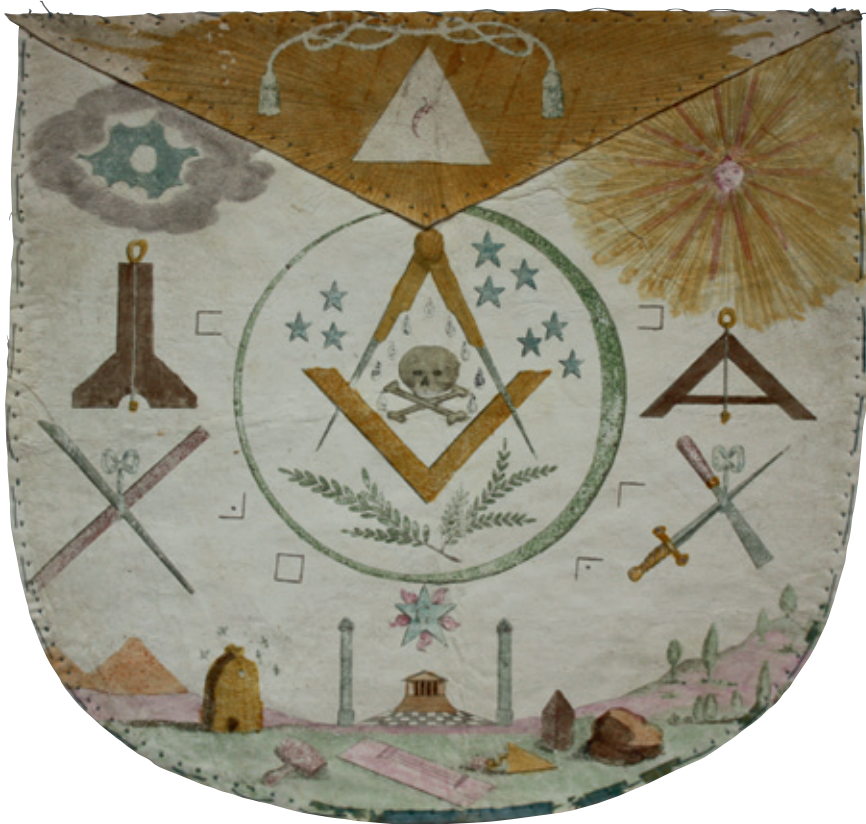
Schootsvel in leder, begin negentiende eeuw (Privécollectie Berend Bunk).

Beide incidenten zijn interessant. Vooreerst tonen ze hoe deze voor de lokale gemeenschap ongetwijfeld ongewone genootschappen door charivari-achtige praktijken konden worden onthaald (denken we maar aan het opduiken van jonge kerels en het buiten jagen van geviseerden). Maar het meest fascinerende is ongetwijfeld het diabolische element. De perceptie van maçonnieke objecten – schootsvellen met schedels (normaliter op de achterkant) bestonden wel degelijk, al heeft die symboliek niets met de duivel te maken – en de stigmatisering door de clerus sloten kennelijk vrij goed bij elkaar aan. Die angst voor het diabolische als eigen aan de vrijmetselarij is treffend, vooral omwille van het tijdsgewricht waarin ze zich situeert. Hoewel er al wel van die associaties waren gemaakt in de achttiende eeuw, toch waren die dan nog vooral satirisch. 10