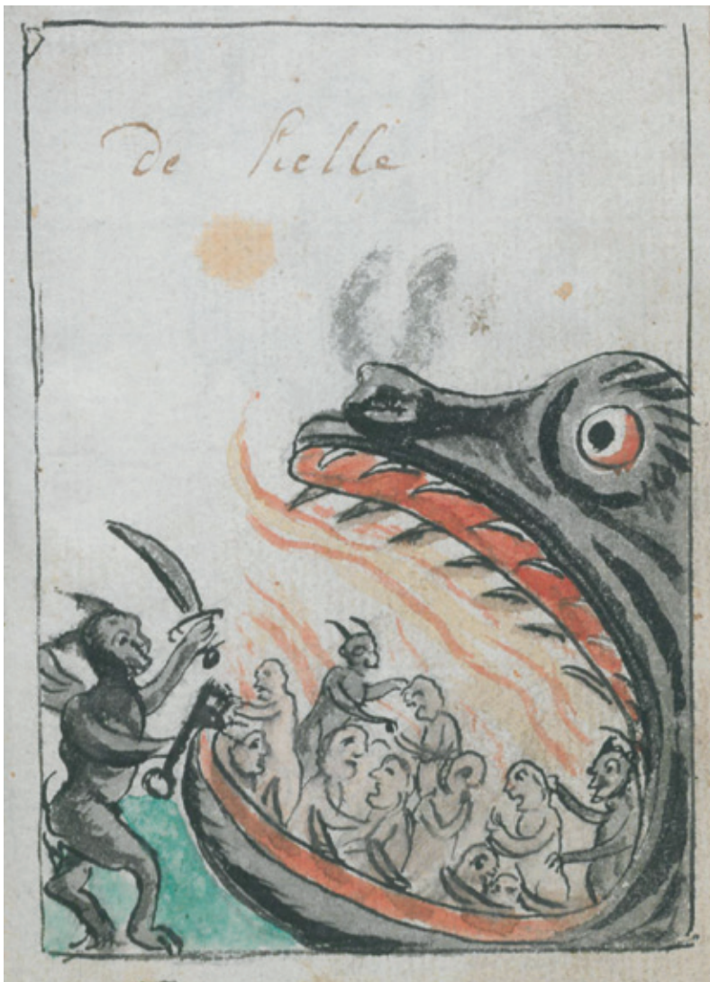
De hel – de reden waarom er gebiecht moest worden. Biechtboekje voor doofstommen, circa 1750 (Bibliotheek van het Ruusbroecgenootschap Antwerpen).

Nadat het geweten onderzocht en de zonden achterhaald waren, was het echter nog niet meteen tijd voor het eigenlijke biechten: penitenten moesten berouw voelen na hun zonden. Veel meer dan het gewetensonderzoek – dat eigenlijk volgens alle priesters zo exhaustief mogelijk moest zijn – was dit een punt van theologische discussie. In sommige handboeken volgde dan ook een lange en theoretische uiteenzetting over volmaakt en onvolmaakt berouw, natuurlijk en bovennatuurlijk berouw, 'contritie' en 'attritie' en de verschillende