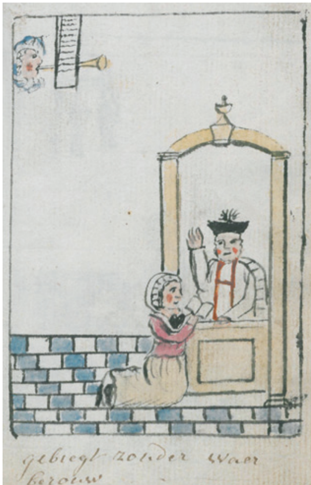
Alle doodzonden moeten opgebiecht worden, met berouw. Biechtboekje voor doofstommen, circa 1750 (Bibliotheek van het Ruusbroecgenootschap Antwerpen).

op te biechten en niet opnieuw te begaan. Te belijden zonden waren alle doodzonden die na een naarstig gewetensonderzoek achterhaald werden, met hun getal en relevante omstandigheden. De minder ernstige dagelijkse zonden moesten niet noodzakelijk opgebiecht worden: die konden met goede werken gecompenseerd worden. Na de biecht moesten penitenten precies doen wat de biechtvader hen oplegde. Alleen zo zouden ze absolutie krijgen en eeuwige pijn in de hel ontlopen. 9