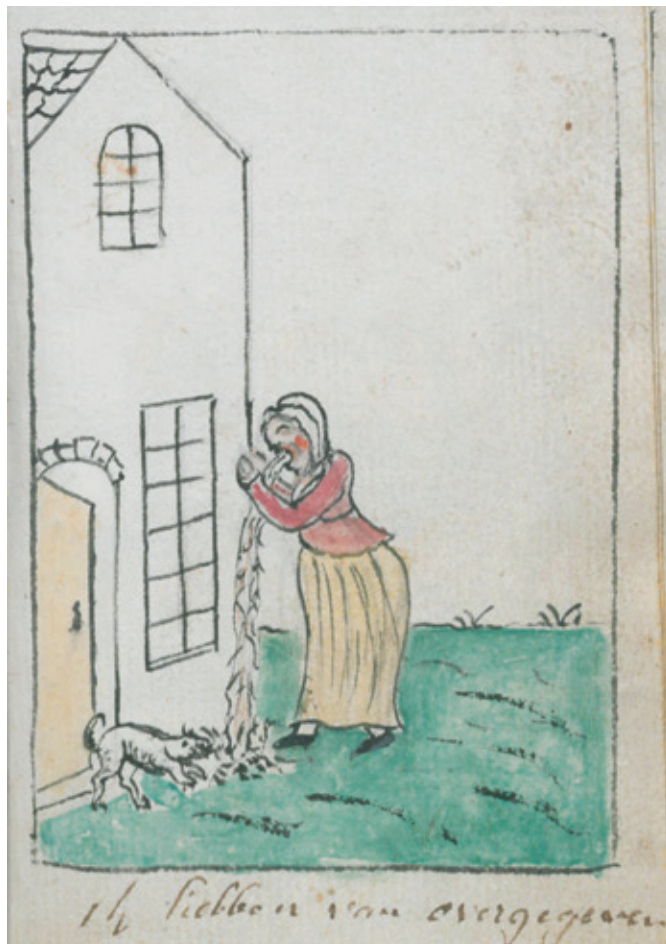
... zeker als het tot braken leidde. Biechtboekje voor doofstommen, circa 1750 (Bibliotheek van het Ruusbroecgenootschap Antwerpen).