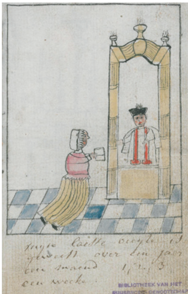
De biecht begint met het verklaren van de tijd die verlopen is sinds de laatste biecht. Biechtboekje voor doofstommen, circa 1750 (Bibliotheek van het Ruusbroecgenootschap Antwerpen).

Na de protestantse bezwaren tegen het sacrament van de biecht bepaalde het Concilie van Trente in 1551 dat de biecht werd bevestigd en zelfs moest worden versterkt. Om de correcte katholieke leer ter zake ook bij alle gelovigen bekend te maken, werd op het Concilie ook bepaald dat er in elk bisdom een catechismus moest worden opgesteld, met daarin de belangrijkste geloofsdoctrines. In de Zuidelijke Nederlanden werd de Mechelse catechismus in 1623 gepubliceerd. Op wat cosmetische aanpassingen na bleef die tot het midden van de negentiende eeuw nagenoeg ongewijzigd.