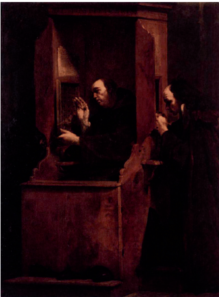
De biecht, uit een reeks van zeven schilderijen over de sacramenten. Giuseppe Crespi, Confessione , 1712 (Gemäldegalerie Alte Meister, Dresden).