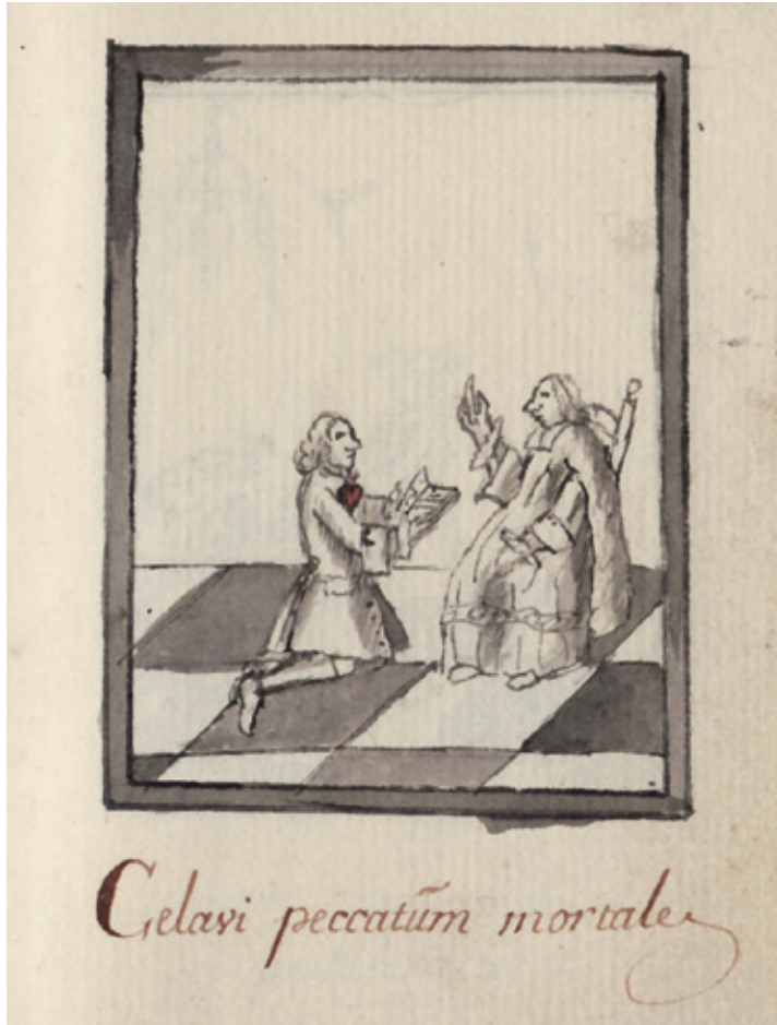
Een doodzonde tijdens de biecht verzwijgen was een nieuwe doodzonde. Tekening uit een biechtboekje voor doofstommen, 1748 (Stadsbibliotheek Kortrijk, Fonds Pastoor Slosse, Codex 392).

Als in processen in de achttiende- en negentiende-eeuwse Zuidelijke Nederlanden biechtvaders als getuigen opgeroepen werden, dan gaven ze (althans on the record ) enkel wat algemene gegevens mee over hoe vaak iemand kwam biechten en of hij of zij dat naar behoren deed. 20