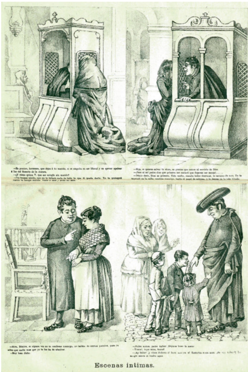
In een reeks spotprenten uit een antiklerikaal Spaans weekblad wordt de draak gestoken met priesters: tijdens de biecht manen ze vrouwen aan om hun liberale mannen te verlaten en eisen ze van knappe vrouwen dat ze in het klooster intreden. Ze zeggen bovendien aan hun dienstmeiden dat ze toch maar niet alles moeten opbiechten en houden er buitenechtelijke kinderen op na. Spotprenten uit El Motín , 1885, 38 (Biblioteca Nacional de Espana, Madrid).

Biechten was een veelvoorkomend ritueel in de Zuidelijke Nederlanden van de achttiende en negentiende eeuw. Bijna alle inwoners van het land gingen minstens een keer per jaar bij hun biechtvader langs om hun zonden te belijden. Desondanks werd het ritueel omringd door een waas van geheimzinnigheid. Wat in de biecht gezegd werd, bleef immers tussen de biechtvader en de biechteling. Niemand wist wat er in de biechtstoel werd verteld – of dat was toch de bedoeling. Net daardoor werd de biecht zo'n enigmatisch fenomeen, dat zowel nieuwsgierigheid als argwaan opwerkte.