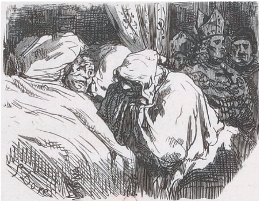
Een stervende legt zijn laatste biecht af. Gustave Doré, La dernière confession , 1855 (Bibliothèque Nationale de France, Parijs).

kennis moesten ze strikt geheimhouden. Dat zorgde enerzijds voor een grotere openhartigheid van de gelovigen, maar had anderzijds ook als gevolg dat ze weinig met die kennis konden doen en dat er onder parochianen soms de wildste biechtverhalen de ronde deden. Toch bleef het gezag van de biechtvaders groot. Slechts weinigen durfden het aan om de biecht te vermijden. Liegen of bewust zonden verzwijgen in de biecht leek al helemaal ondenkbaar. Het trio van vermanen, vergeven en verzwijgen versterkte zo de autoriteit van de priester.