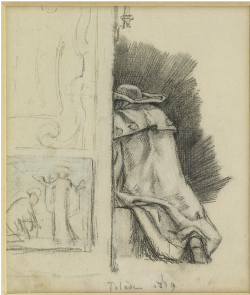
Schets van het biechtritueel door de Belgische kunstenaar Félicien Rops. Confessional, Toledo, 1889 (Walters Art Museum, Baltimore).