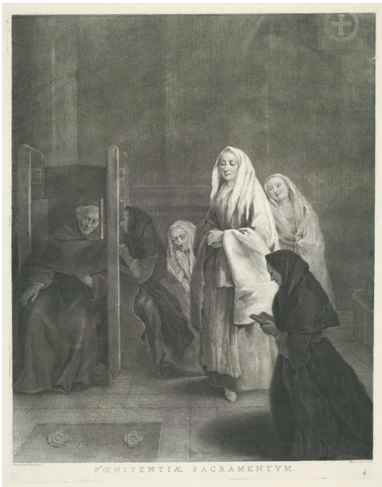
Het sacrament van de biecht. Giovanni Marco Pitteri, Pœnitentiæ Sacramentum , naar Pietro Longhi, circa 1712-1786 (Rijksmuseum, Amsterdam).