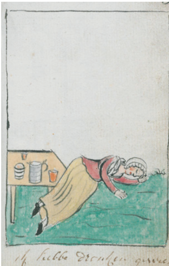
Dronkenschap, een doodzonde. Biechtboekje voor doofstommen, circa 1750 (Bibliotheek van het Ruisbroecgenootschap Antwerpen).

Om het gewetensonderzoek verder te vereenvoudigen voorzagen sommige handboeken hele lijsten met mogelijke zonden. Het meest innovatief daarbij was ongetwijfeld de Gulde biecht-konste van Christoph Leutbriewer. Een eerste versie van dat werk verscheen in het Latijn in 1634 en in de late zeventiende eeuw verscheen er een bewerkte Nederlandstalige versie van. Naast een aantal