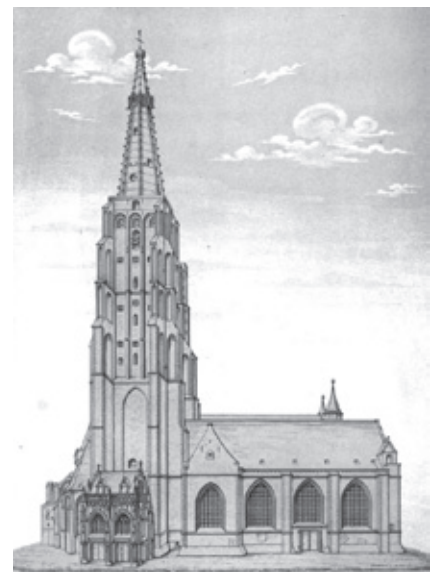
Afbeelding van de Onze-Lieve-Vrouwekerk. Tekening door J.J. Gailliard in Inscriptions .