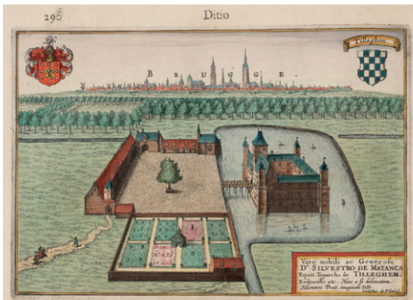
Het kasteel van Tillegem, de heerlijkheid die in de veertiende en vijftiende eeuw in het bezit was van de familie Van Aertrijke in de Flandria illustrata (1641–1644).