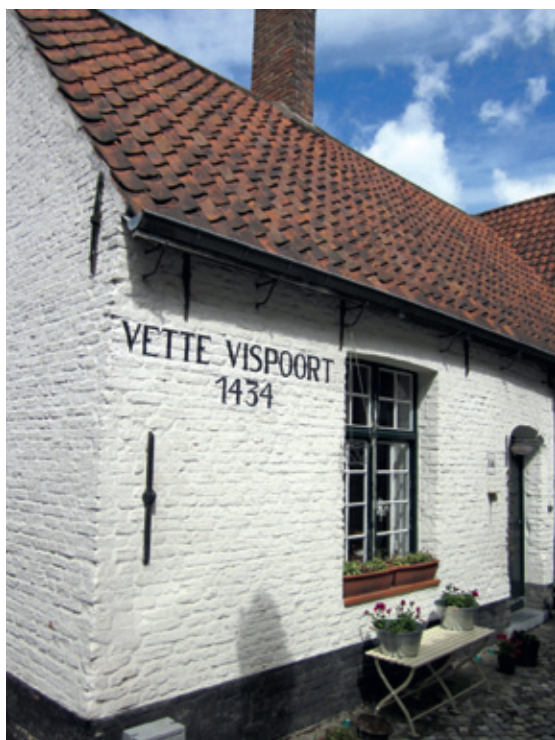
Het godshuis Vette Vispoort is een van de Brugse godshuizen met middeleeuwse oorsprong. Wikimedia Commons.

Centraal in het liefdadigheidslandschap stond de groep van instellingen die rechtstreeks zorg verstrekten aan hulpbehoevenden. 3 De twee grote hospitalen van de stad, het Sint-Janshospitaal en het Onze-Lieve-Vrouw van de Potteriehospitaal, voorzagen onderdak, voedsel en verzorging voor de zieken. Armoede en ziekte gingen bij de onderklasse vaak hand in hand door een gebrek aan een officieel vangnet zoals inkomenscompensatie bij ziekte. De godshuizen richtten zich op de ouderen en in het bijzonder op oude weduwen. Een godshuis bestond meestal uit enkele kleine huisjes rond een gezamenlijke binnentuin. Brugge telde eveneens vier passantenhuizen: Sint-Juliaans, Sint-Joos, het Nazarethhuis en het Sint-Niklaashuis. Een passantenhuis voorzag onderdak en voedsel voor een beperkte duur, vaak maar één nacht, bedoeld om pelgrims op bedevaart en andere passanten te ondersteunen. Het Sint-Niklaashuis opereerde daarnaast als godshuis en Sint-Joos vormde zich in de zestiende eeuw om tot godshuis. De stad beschikte ook over een leprozerie gelegen aan de rand van de stad: de Magdalenaleprozerie. Het blindenkensgasthuis was dan weer gericht op blinden en het Sint-Hubrechtsdulhuis ontfermde zich vanaf de vijftiende eeuw over de krankzinnigen en vondelingen. Voor 1400 zijn er aanwijzingen dat krankzinnigen doorgestuurd werden naar de Magdalenaleprozerie. 4