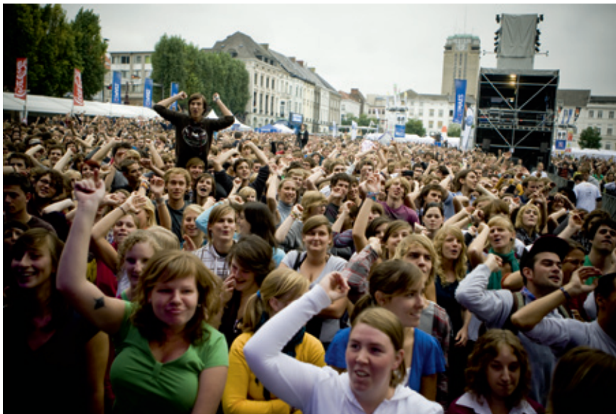
Sinds 2006 organiseren de studenten bij het begin van het academiejaar een Student Kick-Off, een nieuw studentenritueel met festivalstijl.

universiteit die steeds naar aanleiding van een jubileum werden samengesteld. Na het langetermijnperspectief dat de Libri als bron voor jubilea bieden, komt de casus van de Dies Natalis aan bod.