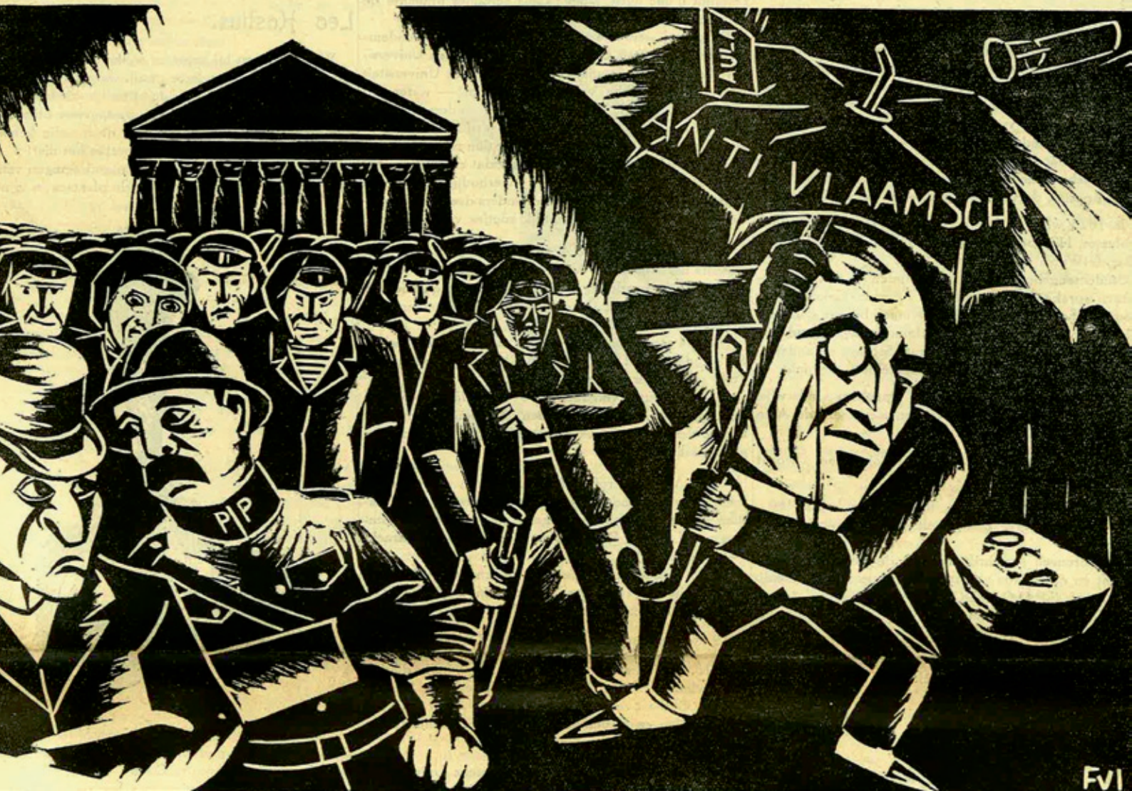
Het Gentsch Studenten Corps organiseerde in 1933 de eerste Dies Natalis van de UGent als reactie op het toenmalige universiteitsbestuur. ( Aula , 1:4 (1933) 1)