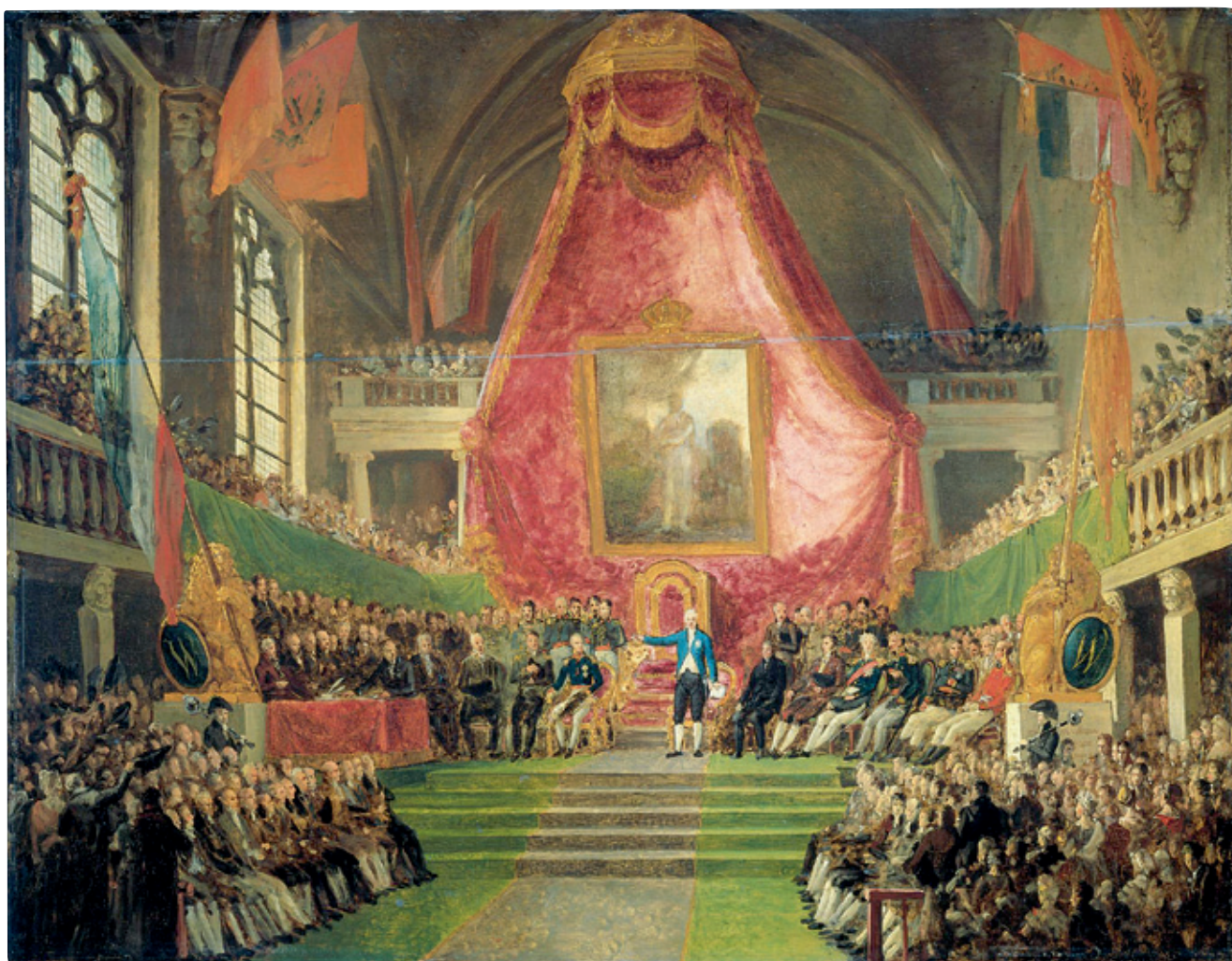
Mattheus Van Bree vereeuwigde de plechtige installatie van de Gentse universiteit door de prins van Oranje in de troonzaal van het stadhuis op 9 oktober 1817.

Voor historici zijn deze inzichten bijzonder vruchtbaar. Het betekent dat we via de studie van de omgang met rituelen de veranderende eigenheid van een instelling en haar (gewenste) zelfbeeld kunnen blootleggen. Welke nieuwe academische tradities wijzen op fundamentele omslagen aan de universiteit en het academisch leven? Wat zeggen vorm en invulling van rituelen over de voorstelling die de universiteit van zichzelf maakt voor de buitenwereld? Welke plaats krijgt de diverse academische gemeenschap in die rituelen? 8 We onderzoeken de kwestie voor de UGent aan de hand van het universitaire jubileum