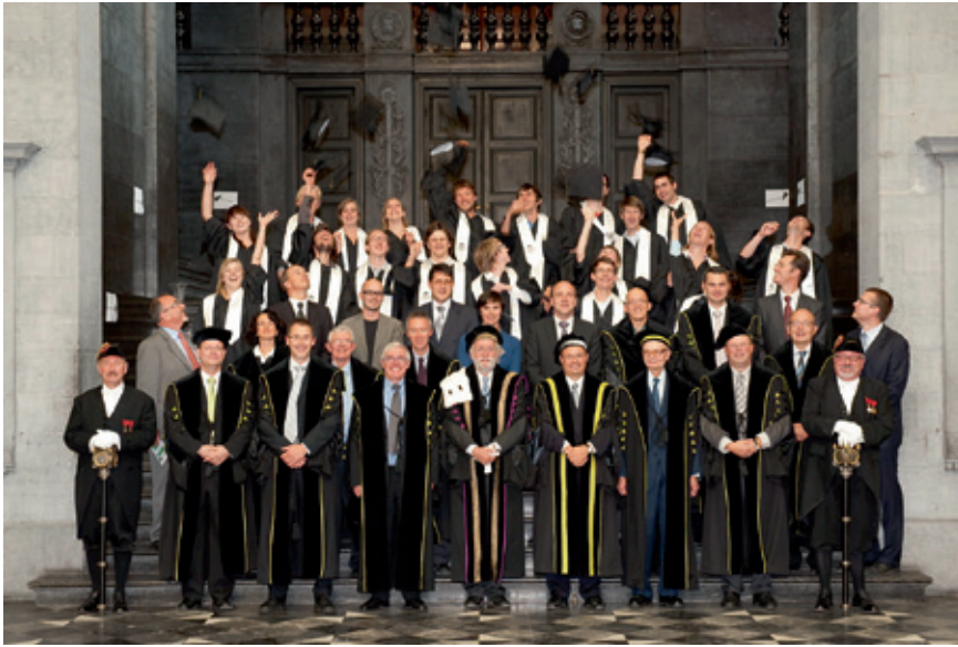
Deze studenten van de faculteit Economische Wetenschappen zijn in 2009 bij de eersten die in mastertoga afstuderen. (© Nic Vermeulen).

en Dies Natalis , of stichtingsdag: twee hoogtepunten op de academische kalender die met veel ritueel en ceremonie gepaard gaan. Anderzijds zijn ze allesbehalve uniek voor de universitaire context: verjaardagen zijn ook voor gemeenten, verenigingen, bedrijven en scholen de gelegenheid om aan een uitvoerige introspectie én public relations te doen. Een universitaire gemeenschap lijkt in menig opzicht op een lokale gemeenschap. Het is een zeer diverse groep waar je kortstondig of heel je leven deel van uitmaakt; waar sommigen zich heel expliciet mee identificeren en anderen functioneel tegenover staan; met verkozen leiders die proberen in te spelen op de noden van de universitaire bevolking, maar die ook gebonden zijn aan allerlei regels van andere overheden; die verspreid is over tientallen adressen; die zich omwille van praktische, sociale en culturele redenen opsplijt in allerlei stuurgroepen, verenigingen, enzovoort.