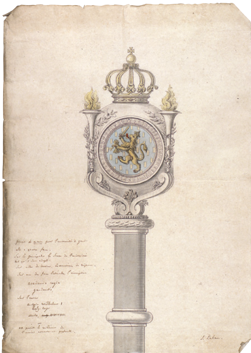
Ontwerptekening voor de scepter van de Gentse universiteit door Lieven Debaux uit 1816. (A02_001).

1913. Het plan toont aan dat hoewel de UGent officieel een rijksinstelling was, de identificatie van het korps met de stad die haar (ook financieel) huisvestte groot was en bovendien niet tegenstrijdig met het vaderlandse karakter van de universiteit. 15