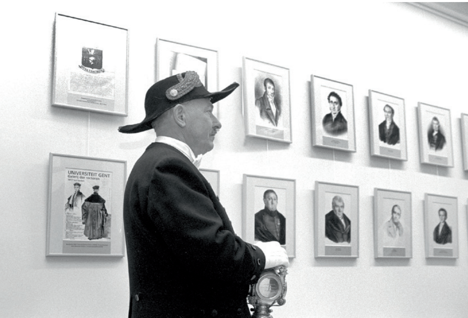
De bode van de UGent bij de rectorengalerij in de Aula Academica. (E01 2005 013,).

hun legitimiteit in tijden van Europese universitaire expansie en de installatie van de onderzoeksuniversiteit via hun verleden trachten te onderstrepen. Door allerhande vertragingen kwam er van het Gentse Liber niets in huis. Een tweede poging werd ondernomen in 1905, met vijfenzeventig jaar België als gelegenheidsargument. 12 De UGent was immers, net als de universiteit van Luik en in tegenstelling tot de vrije universiteiten van Leuven en Brussel, een rijksuniversiteit. Wetenschap en onderwijs stonden expliciet ten dienste van het vaderland. Blijkbaar was het in de negentiende eeuw voor een universiteit niet vreemd om behalve de eigen verjaardagen, ook die van de inrichtende macht te vieren! Ondanks de opvolging van het project binnen de Academische Raad raakte enkel het deel van de faculteit Letteren en Wijsbegeerte klaar voor publicatie. Het voorstel van de historicus Henri Pirenne om alvast dat deel uit te brengen, werd afgewezen door de bevoegde minister van Kunsten en Wetenschappen. 13 De grip van de regering op het reilen en zeilen van de universiteit was op dat moment groot en voor decentrale, facultaire manifestaties was geen draagvlak. 14 In juni 1911 werd door de Academische Raad een derde maal initiatief genomen voor een Liber Memorialis , ditmaal met succes. De gelegenheid die daarvoor werd aangegrepen, was de Wereldtentoonstelling in Gent in