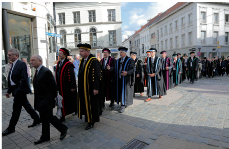
De kleurrijke verzameling decanen van de UGent loopt in de stoet der togati door de Gentse binnenstad aan het begin van het academiejaar 2015–2016.

Het plechtig ceremonieel van Dies Natalis is tot in de puntjes vastgelegd en start met de stoet der togati. Het dragen van toga's, een recht dat is voorbehouden aan de hoogleraren, is essentieel voor de theatraliteit van de stoet. De toga's zijn zwart en naargelang de faculteit waartoe men behoort, krijgt men kleurige franjes. De Gentse stoet wandelt van de ene ingang van de Aula, via de Emiel Braunschouwen enkele huisnummers verderop, naar de hoofdpoot van de Aula. De korte afstand verhindert in feite een van de belangrijkste functies van de stoet, namelijk de manifestatie van het academische korps aan de buitenwereld. Sinds 2014 wandelt de stoet naar aanleiding van de opening van het academiejaar daarom van het rectoraat in de Sint-Pietersnieuwstraat, door de Gentse winkelstraten, naar de Aula. De volgorde en de kledij van de hoogleraren en vertegenwoordigers die in de stoet meelopen, zijn aan een strikt protocol onderworpen en kunnen variëren naargelang de gelegenheid