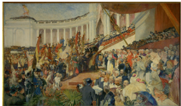
Viering van de vijftigste verjaardag van de Belgische onafhankelijkheid, in 1880. Camille Van Camp, Cinquantenaire de l'indépendance 16 août 1880 © KIK-IRPA, Brussel.