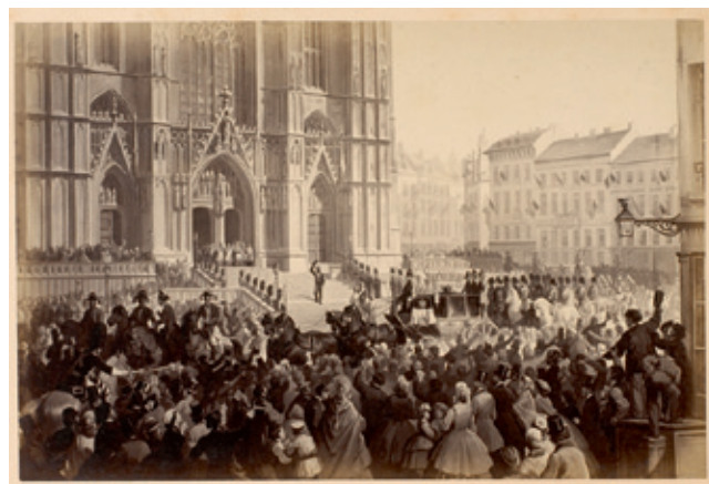
Historieprent Te Deum à Ste Gudule/Réception du Roi Léopold II , ed. Chémar, frères, 1866.

‘geëxcommuniceerd zijn, en toch worden we uitgenodigd om deel te nemen aan een religieuze ceremonie. Heeft de geachte heer Nothomb de macht om excommunicatie op te heffen. ( Hilariteit ter