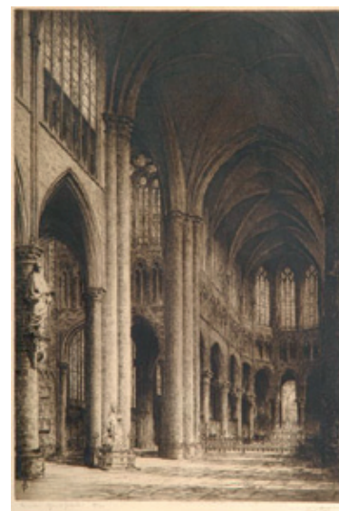
De kathedraal Sint-Goedele en Sint-Michel in de negentiende eeuw. Ferdinand Giele, Intérieur de Sainte Gudule © KIK-IRPA, Brussel.