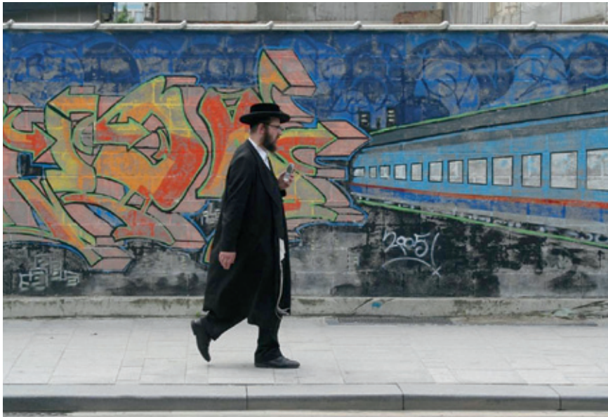
Pelikaanstraat, Antwerpen.