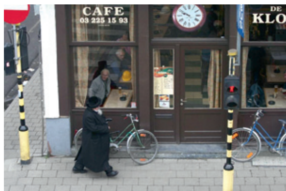
Café De Kloek, hoek Pelikaanstraat met Lange Kievitstraat, Antwerpen.