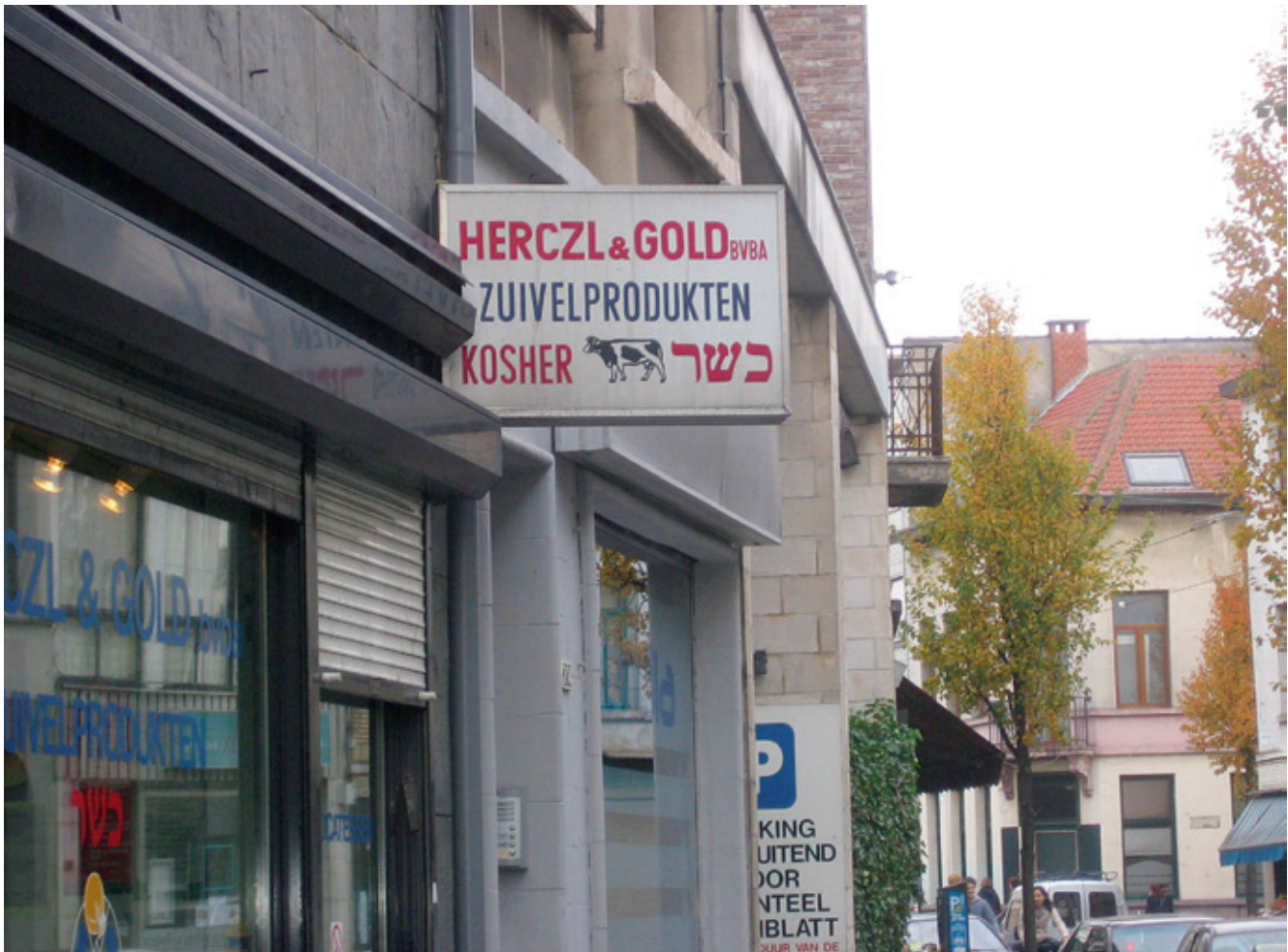
Koosjere zuivel en kaas, Herczl & Gold, Provinciestraat, Antwerpen.

erkende joodse gemeenten uitgebouwd, gezien de relatief hoge kosten die ze met zich meebrachten. Het gaat dan over rituele badhuizen ( mikva's , speciaal gebouwd bad voor joods reinigingsritueel waarbij niet de hygiëne, maar de spirituele reinheid centraal staat), het voorzien van en de controle op koosjer voedsel (bakkers, beenhouwers, kruideniers, viswinkels), joodse (dag-)scholen en studiehuisen, een begrafenisvereniging ( chevra kadiesja ) en het instellen van een eroev .