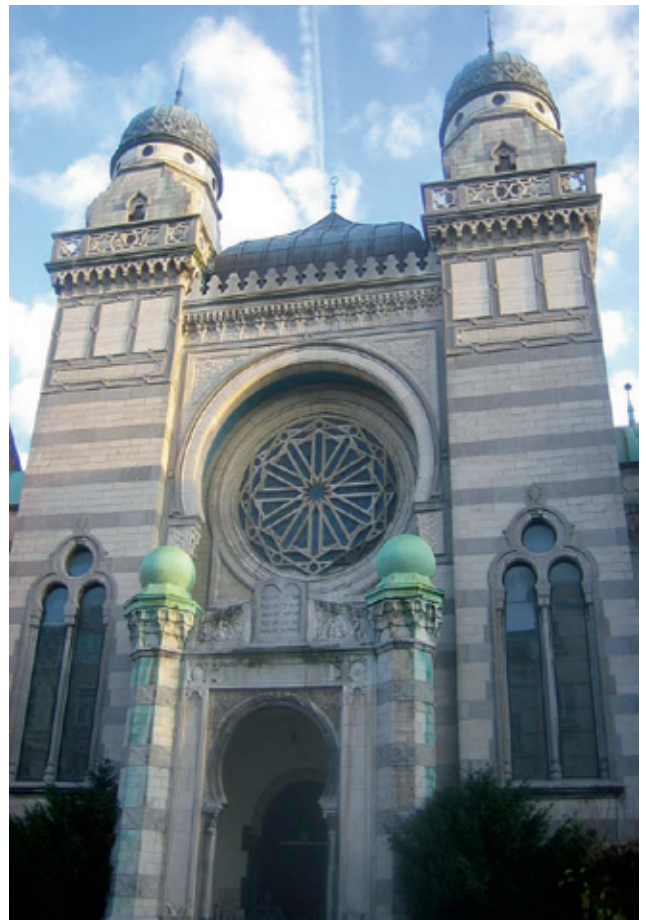
De synagoge in de Bouwmeestersstraat.