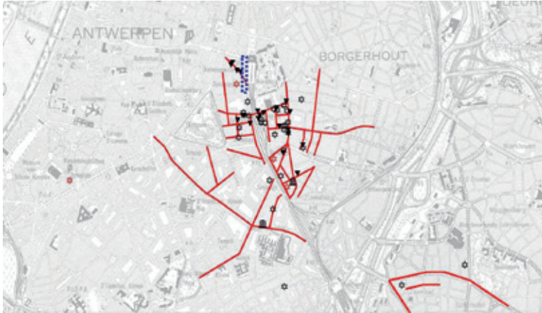
De joodse buurt in de jaren 1933–1942.

in Antwerpen behouden bleef na de migratieperiode. De joodse buurt en haar evolutie is duidelijk zichtbaar op onderstaande kaarten.