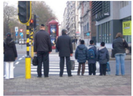
Joden met keppeltjes op de hoek Charlottelei met Platin en Moretuslei, Antwerpen.

antisemitisme – zo weinig mogelijk de aandacht trekken. Nieuwkomers uit Oost- en Centraal-Europa brachten echter een tegenovergestelde evolutie teweeg. Hun uiterlijke 'opvallen' in kledij en haartooi leidde tot ongerustheid bij de reeds gevestigde lokale orthodoxe groepen en bij internationale joodse hulporganisaties. Ze wisten niet goed hoe om te gaan met deze groep die zich in een West-Europese context zo strikt aan de rituelen en regels van de joodse godsdienst hield. Beatrice Vulcan schreef eind 1946 aan het hoofdkantoor van het American Jewish Joint Distribution Committee in New York: 'I think you might be interested to know that such tremendous numbers of orthodox Jews in round hats, long beards, and longer coats, have been pouring into Antwerp that the Committee there decided that they would not give relief to anybody who did not wear a conventional fedora. The Committee provided the fedoras.' 10 Het lukte het Antwerpse Comité echter niet om de meer opvallende kledingdracht af te remmen; de groeiende aanwezigheid van orthodoxe joden, onder wie veel chassidim, zorgde zelfs voor een versterking en verstrenging in de uiterlijke herkenbaarheid. Dat zien we bijvoorbeeld in foto's van de joodse meisjesschool Beth Jacob.