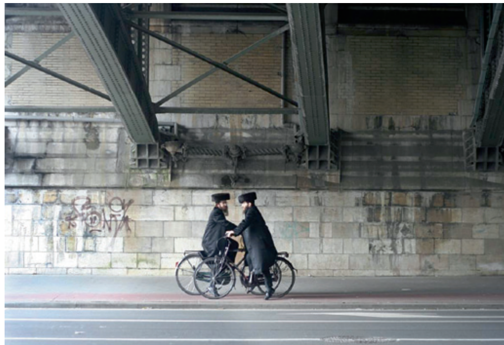
Brug Belgiëlei-Van Den Nestlei, Antwerpen (Foto Dan Zollmann).

Verder valt het op hoe men orthodoxe joden vooral in één buurt aantreft. Omdat het gebed zo'n belangrijke plaats binnen het orthodox-joodse leven inneemt, hebben orthodoxe joden hun huis, werkplaats en gebedshuis graag op wandelafstand van elkaar. Orthodoxe mannen bidden driemaal per dag,