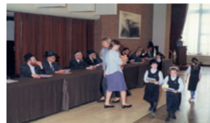
Meisjesleerlingen van de Beth Jacob-school omstreeks 2000 (Archief Jesode Hatora – Beth Jacob).