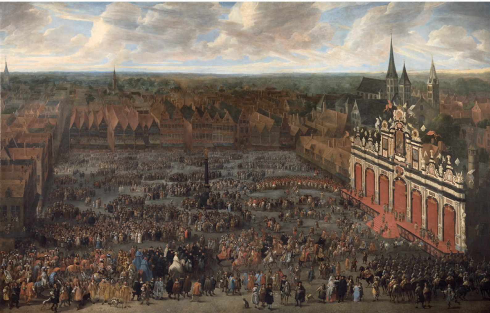
Monumentaal schilderij door François Duchatel (1668) van de inhuldiging per procuratie van de Spaanse koning Karel II in Gent in 1666. STAM Gent © foto Studio Claerhout.

enthousiast was als de officiële kroniekverslagen of gedrukte beschrijvingen doen uitschijnen. De vele ordonnanties die voorschrijven hoe men zich moest gedragen spreken boekdelen. Ook morden de ambachtsgilden geregeld over de hoge kosten. Bovendien hebben een aantal mooie studies aangetoond dat Blijde Intredes ook wel eens uit de hand liepen en uitdraaiden op oproer tegen de vorstelijke entourage of tegen de eigen stedelijke overheid. 11 Daar staat tegenover dat de laatmiddeleeuwse en vroegmoderne stedelingen het vorstelijke gezag zelf zelden in vraag stelden. Bovendien werden de wijnfonteinen, gelduitdelingen en het andere vertier wel degelijk gesmaakt. Gelukkig beschikken we over een aantal bronnen die het niet-officiële gezichtspunt documenteren. Dat zijn in de eerste plaats privé-kronieken. Voor Gent bestaan er bijvoorbeeld heel wat memorieboeken en kronieken die zorgvuldig werden bijgehouden door poorters of ambachtslieden. 12 Het gaat hier natuurlijk niet om de onderste lagen van de bevolking. Als men dergelijke kronieken naast de officiële beschrijvingen legt, blijkt toch dat er vaak andere geluiden te horen zijn. Dit is dus een pleidooi om die vaak veronachtzaamde handschriften, bewaard in bibliotheken en archieven, in het onderzoek van de lokale publieke rituelen te betrekken.