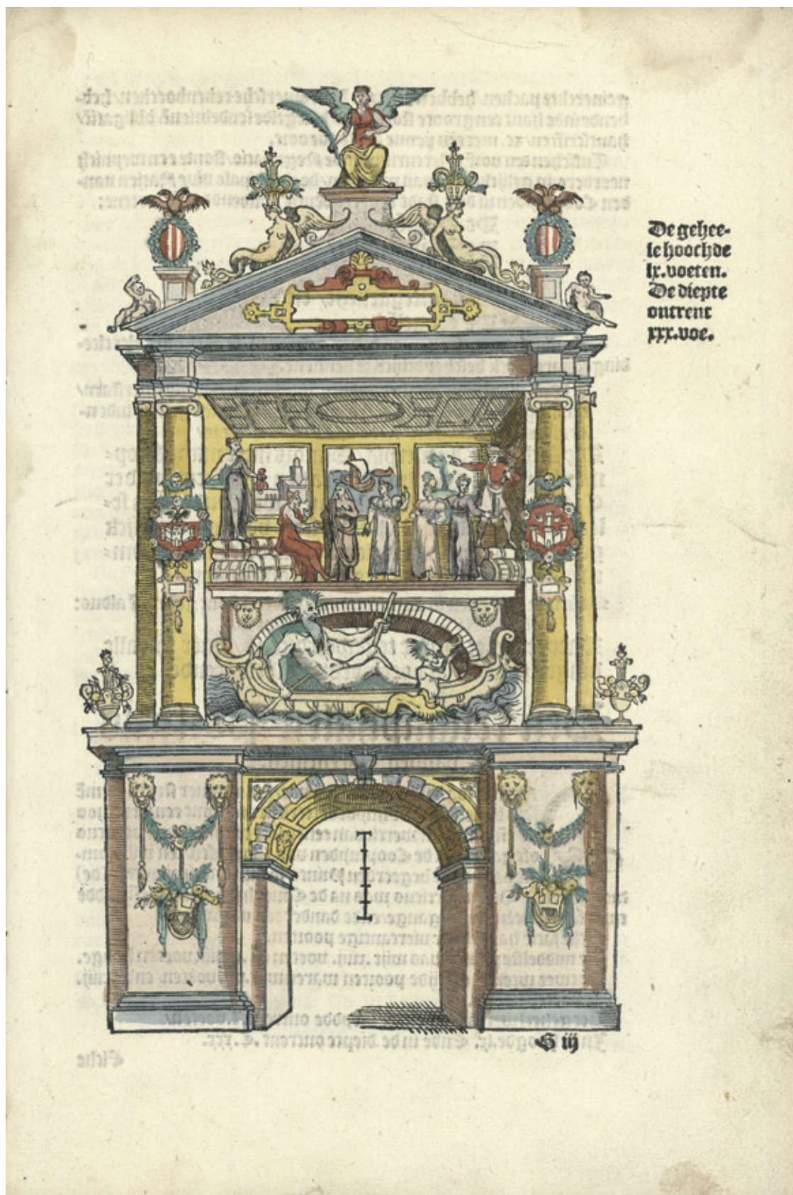
Triomfboog met de riviergod Scaldis (Schelde) uit het festivalboek ter gelegenheid van de Blijde Intrede van Filips II in Antwerpen in 1549 © Universiteitsbibliotheek Gent, Res. 1191.