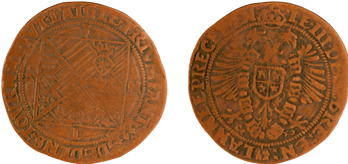
Bronzen gedenkpenning geslagen ter gelegenheid van de intrede van Karel V in Doornik in 1531 © Universiteitsbibliotheek Gent.

modellen? Daarnaast worden ook heel wat losse tekeningen en prenten bewaard (bijvoorbeeld in de Atlas Goetghebuer in het Gentse Stadsarchief) en beschikken we over een aantal monumentale schilderijen. Een mooi voorbeeld is het enorme doek van Frans Duchatel in het STAM te Gent, dat de inhuldiging (per procuratie) in 1666 van de Spaanse koning Karel II als graaf van Vlaanderen op de Vrijdagmarkt toont.