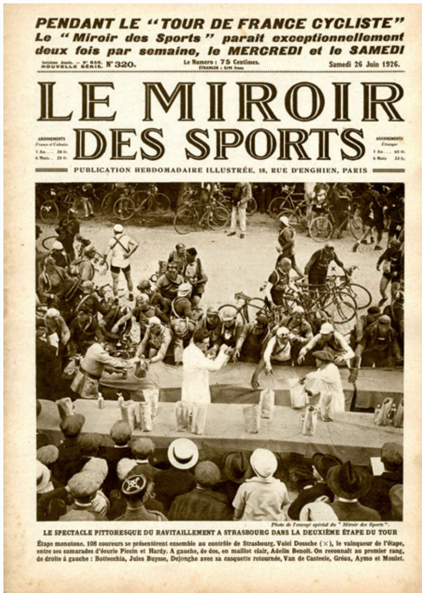
Cover Le Miroir des Sports : 'Een beeld zegt (soms) meer dan duizend woorden.' Bevoorrading avant la lettre tijdens de Tour de France op de cover van een Frans sporttijdschrift.

kunnen rennersbiografieën de lezer een eerste inzicht geven in bijvoorbeeld opvattingen over eten en drinken tijdens een bepaalde periode. Omdat een rennerscarrière doorgaans ongeveer tien jaar duurt, resulteerde het doornemen van een vijftal biografieën van renners uit achtereenvolgende periodes in een eerste inzicht in veranderende eet- en drinkgewoontes doorheen de tijd.