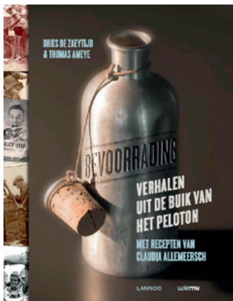
Bevoorrading vertelt het verhaal van een eeuw eten en drinken in de koers

Wie onderzoek wil voeren, kan zich best eerst 'inlezen'. Een (thematische) literatuurlijst of bibliografie is hierbij een geknipt hulpinstrument. Voor de wielervedicatie bestonden tot voor kort echter geen bibliografieën die een thematisch of chronologisch overzicht bieden van wat verschenen is. 9 Pas sinds de publicatie van een Franstalige bibliografie, samengesteld door Wilfried Wilms eind 2012, is er echt sprake van een wielervedicatiebibliografie. 10 Voor Bevoorrading kwam deze literatuurlijst echter te laat. Binnen de bibliotheek van het Wielermuseum werd daarom in eerste instantie gezocht naar wielervedicatieboeken die voeding centraal stellen. 11 Het resultaat van deze eerste zoektocht was mager. 12 Daarom werd overgegaan tot het doornemen van biografieën van renners. Deze werken bevatten in hoofdzaak een carrière-overzicht van de betrokken renner, maar ook vaak fait-divers van uiteenlopende aard. Op die manier