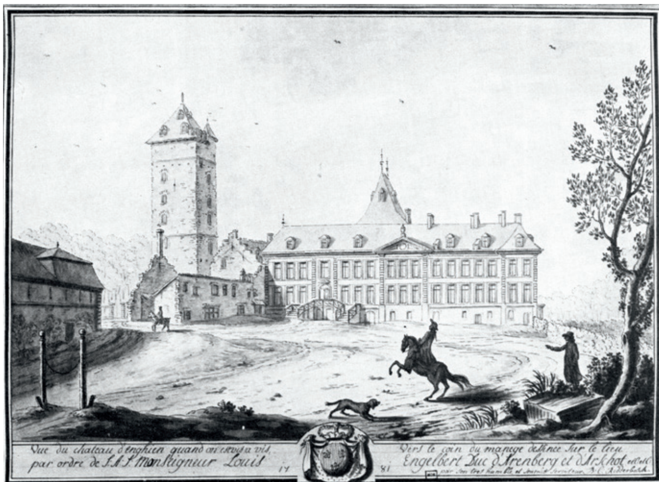
(Arenbergarchief Edingen (verder AAE), Zicht op het kasteel van Edingen door Ridderbosch (18 de eeuw), © Studio Berger)

door op korte termijn grote percelen te kappen? Of hanteerde men een langetermijnstrategie, waarbij men jaarlijks een beperkter areaal kapte, zodat de vegetatie kon regenereren? Specifiek hebben we hierbij aandacht voor de interactie tussen het beleid op het terrein en structurele evoluties binnen de West-Europese samenleving. De stijging van de houtprijzen in de zeventiende eeuw ten gevolge van de ontstane schaarste maakte een ondoordachte kapstrategie immers des te verleidelijker. Anderzijds kon een economische rationalisering van het beheer inkomsten op de langere termijn garanderen. Het domein van de Arenbergs in de zeventiende en achttiende eeuw, meer specifiek het Land van Edingen en het prinsbisdom Rebecq, vormt de casestudy waaraan we deze vragen aftoetsen. Deze bijdrage pretendeert geenszins het finale oordeel te vellen over het bosbeheer in de Zuidelijke-Nederlanden. Eerder hopen wij een leidraad te bieden voor andere historici, zowel op methodologisch als inhoudelijk vlak.