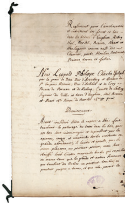
Eerste pagina van het bosbouwreglement van 1730. (AAE, SEM inv. nr. 18, Règlement pour l'amélioration et l'entretien des forest et bois dans les terres d'Engghien, Rebecq, Hal, Bersel, Braine, Naast et Heuseignies comme aussi des chemins, ponts, moulins, batiments, prairies, terres et fosses.)

andere domeinen, waaruit bleek dat (kleine) bonussen een positief effect hadden op de inzet van de rentmeesters, die op dat moment reeds onder stevige controle van dezelfde centrale administratie stonden. 42