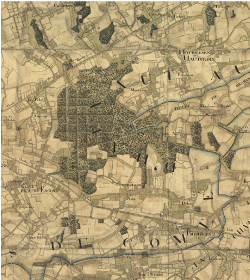
De bossen van Ter Rijst (Risoir) en Strijdhout (Strihoux), waarbij het door dreven verdeelde deel van het Strijdhoutbos eigendom van de Arenbergs was (Fragment van ARA, AF, Arenberg kaarten en plannen, inv. nr. 2572, Carte topographique du Baillage d'Enghien au comté d'Hainaut)

lokale heer van Ter Rijst (Risoir) een van de voornaamste was. 45 Op de kaart zijn de inspanningen van de hertog en zijn administratie duidelijk zichtbaar. Het bos is doorregen met verschillende dreven, met het oog op een oordeelkundiger kapschema te kunnen volgen. Ook de verhoogde controle op de rentmeesters en de nieuwe verloningsstructuur wierp vruchten af. Zowel de briefwisseling tussen de hertogelijke raad en de beheerders op het terrein als verschillende rapporten opgesteld door de rentmeesters wijzen er op dat men proactief speurde naar verbeteringsmogelijkheden en opportuniteiten in de beplanting en het onderhoud. 46