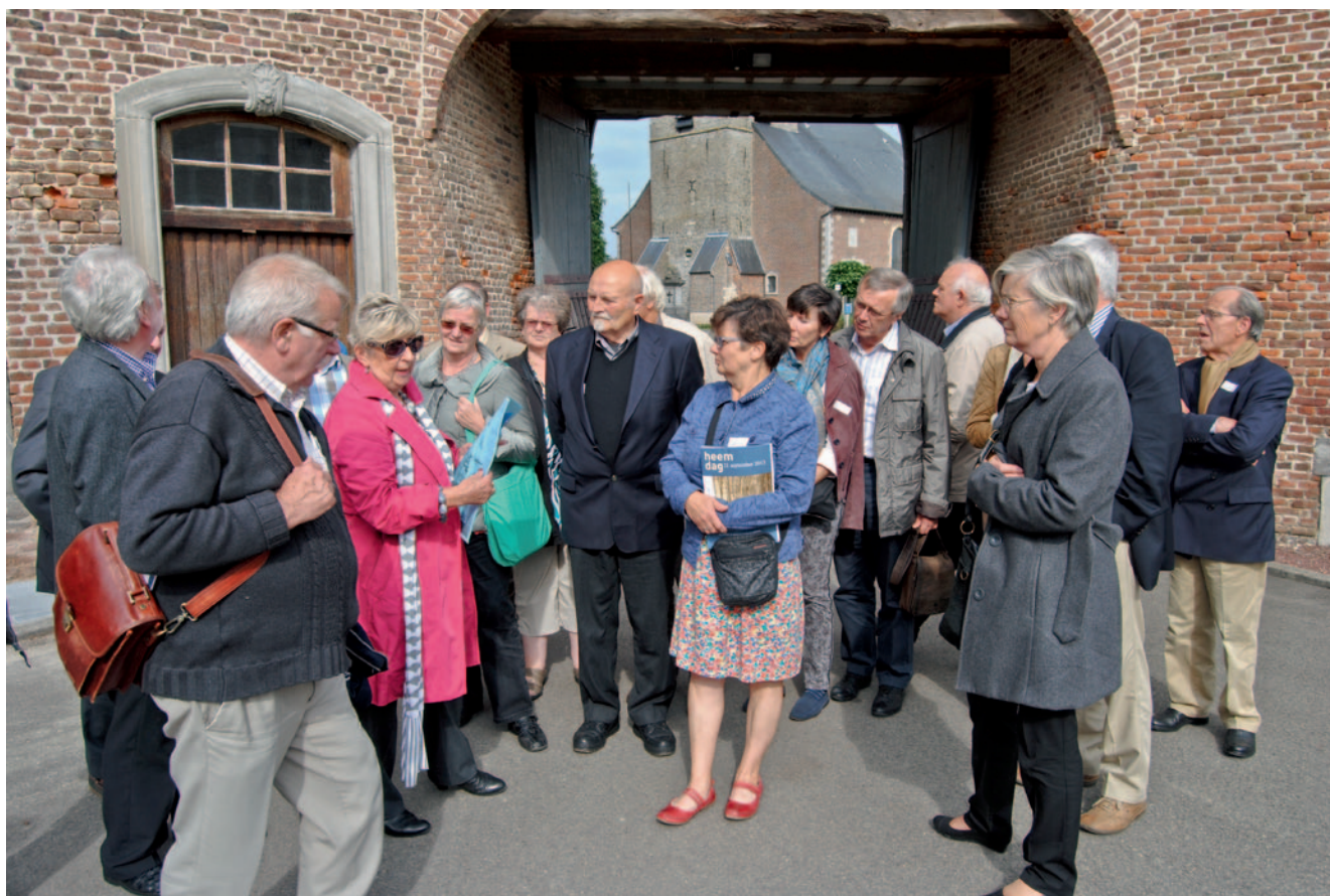
Beeld van de Heemdag van 21 september te Heers. Deze Heemdag, een ontmoetingsmoment voor Vlaamse heemkundigen, wordt jaarlijks georganiseerd door Heemkunde Vlaanderen.