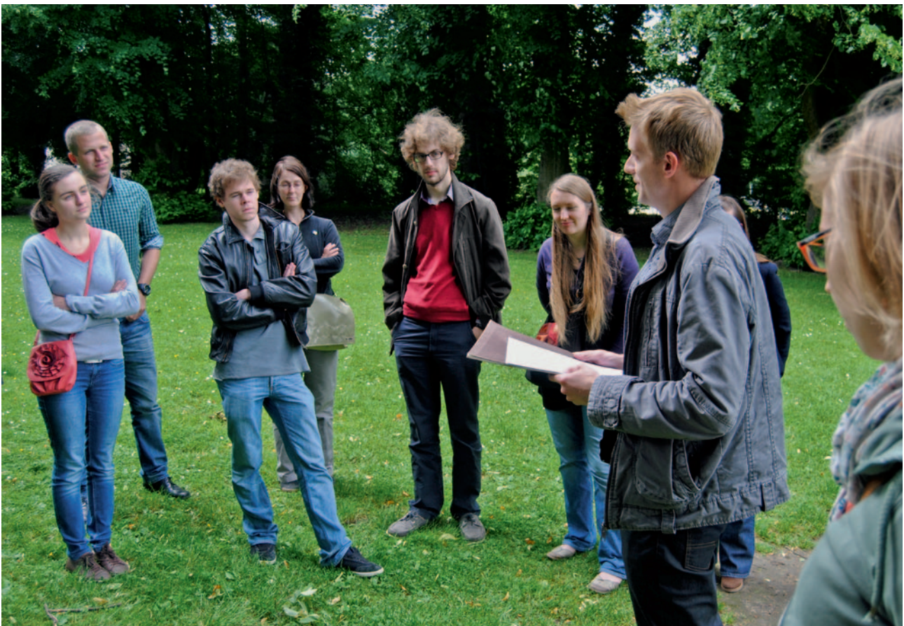
Sfeerbeeld van de jongerenontmoetingsdag van mei 2012, waar jonge heemkundigen ervaringen konden uitwisselen.

Toch schuilt in dat negatieve discours ook een gevaar. Het besef dat een continue investering in het netwerk noodzakelijk is, is positief, maar de roep om vers bloed mag niet te luid klinken. Het kan immers de perceptie van een netwerk in verval in de hand werken. Een heemkundig netwerk waarin het verhaal van het lokale verleden op een open, positieve en eigentijdse manier wordt gebracht, investeert in haar eigen voortbestaan. De rol die het tijdschrift hierin speelt, is opvallend.