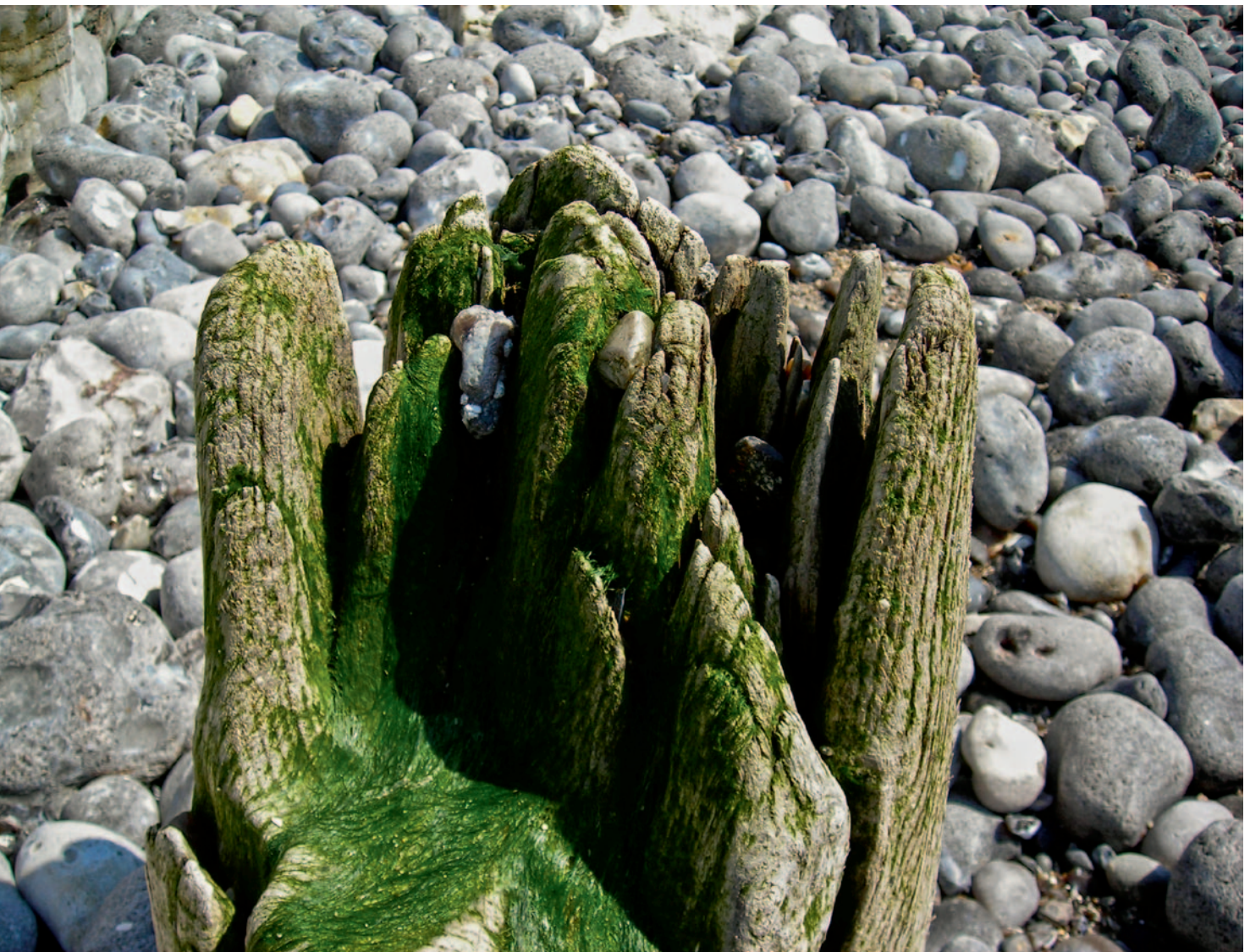
Een kiezeland, een beeld dat een heemkundige onlangs gebruikte om heemkunde te typeren.