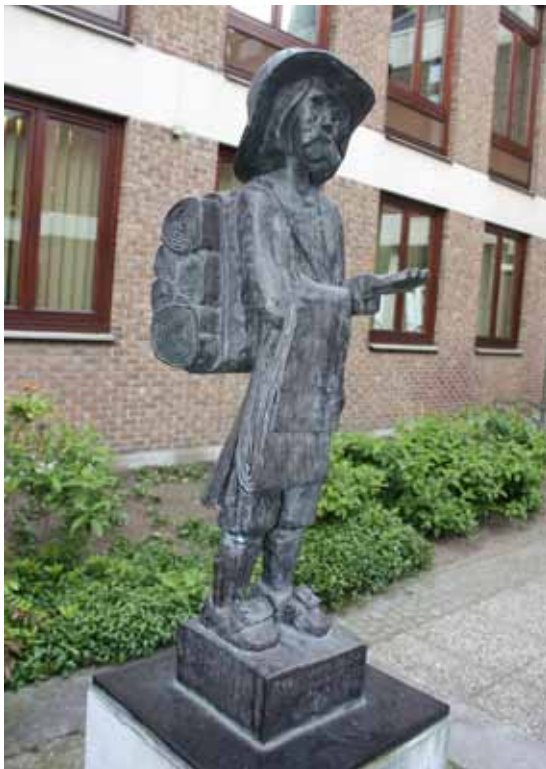
Het teutenbeeld in Hamont