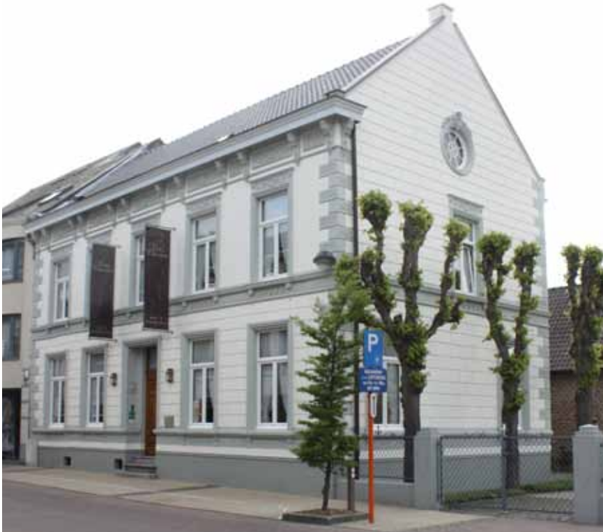
Het voormalige teutenhuis Feyen in Hamont

brouwer of lokale (groot)handelaar, waren in staat om te concurreren met de teuten. Onrechtstreeks is de invloed van teuten nog merkbaar in het soms nog bewaard industrieel erfgoed. Teuten belegden tijdens de eerste fase van de industrialisering van Noord-Limburg in lokale molens, stokerijen, brouwerijen, kaarsenfabrieken, enzovoort. Teuten waren ook dikwijls erg vrijgevig wanneer er een school of kerk gebouwd of hersteld moest worden. Teuten schonken in het bijzonder veel aan hun lokale kerk, onder de vorm van liturgische voorwerpen, kerkmeubelen, schilderijen en glasramen.