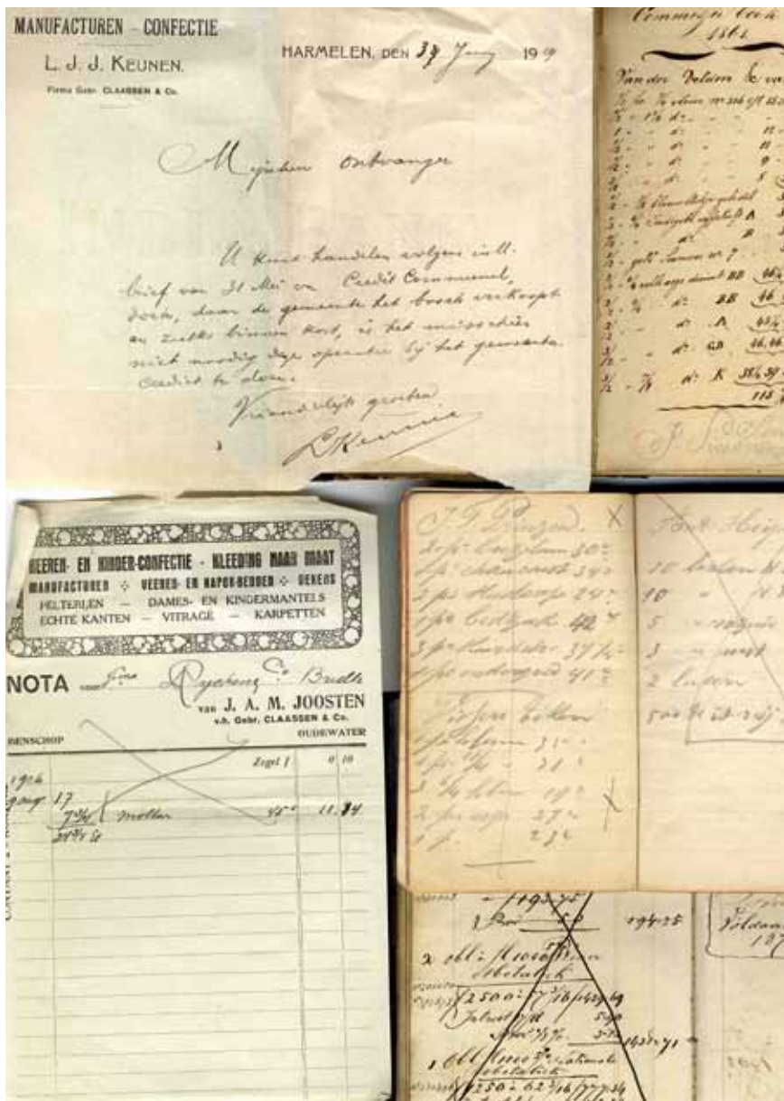
Archivalia van teuten (eind negentiende – begin twintigste eeuw)