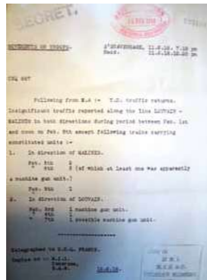
Origineel rapport (bewaard in het Franse legerarchief in Vincennes).