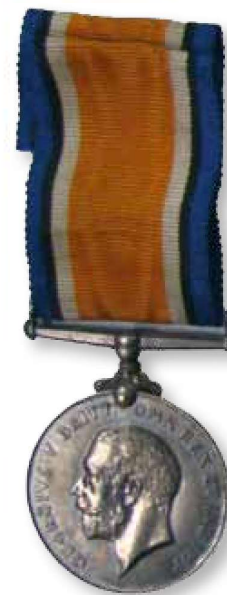
British War Medal.

Ook aan de andere kant van het kanaal werd er ondertussen grondig werk gemaakt van een erkenningsronde. Omdat de meeste Belgische en Noord-Franse spionnen in dienst van de Britten werkten, eerden ook zij hun buitenlandse krachten. Bijna alle spionnen kregen in de loop van 1919 het British War Medal toegekend. Dankzij de verschillende lijsten uit deze twee archieven kan er vandaag voor elke stad of elk dorp een lijst worden opgemaakt van de lokale geheime agenten van Eerste Wereldoorlog. Bovendien kunnen die lokale studies leiden tot een meer anekdotische aanpak. Vaak kennen nabestaanden weinig van het grote spionageverhaal, maar wel kleine details die van generatie op generatie werden doorgegeven.