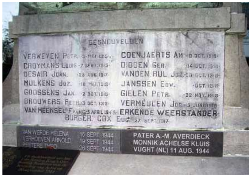
Op vele plaatsen verschenen de namen van de slachtoffers van de Tweede Wereldoorlog op het reeds bestaande WO I-monument. In Achel gebeurde dat in verschillende stappen. De plaat met de naam van verzetsman pater Averdick werd pas in 2010 onthuld.

Natuurlijk was het na de Tweede Wereldoorlog niet al continuïteit wat de klok sloeg en zagen in de onmiddellijke naoorlogse periode tientallen nieuwe herinneringsoorden het levenslicht in Limburg. Veel gebeurtenissen die zich hadden afgespeeld tijdens de bezettingsjaren of in de bevrijdingsdagen waren zo nieuw en uniek geweest, dat ze geen neerslag konden krijgen op bestaande herdenkingsplaatsen. Vermoorde of in concentratiekampen omgekomen medeburgers kregen een gedenkplaat of een straatnaam, plaatsen van terreur