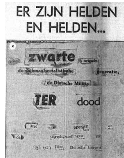
Op 14 februari 1942 contrasteerde De Toekomst de dapperheid van de Vlaamse Oostfronters met de kleingeestigheid van de opstellers van een anonieme dreigbrief. De tekst luidt: 'De zwarte Brigade de nationaalsocialistische generatie, de Dietsche Militie ter dood. Met U openen wij de terechtstellingen na den val der Duitse troepen.'