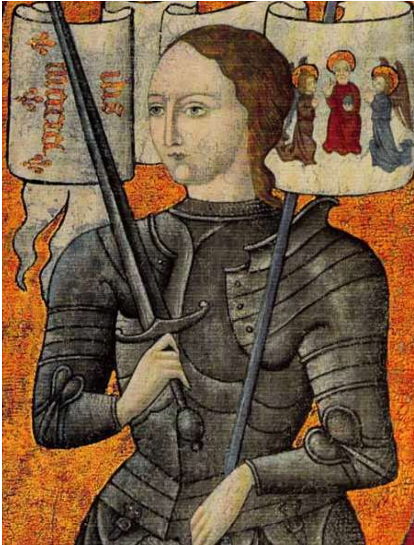
Jeanne d'Arc, de Franse nationale heldin, droeg mannenkieren en stierf als maagd.

hun strikte genderrol zouden doorbreken. Overigens was/is de beeldvorming over vrouwelijke helden nauw verbonden met de heersende genderideologie. Naarmate de scheiding tussen publiek en privé, tussen man en vrouw, strikter werd, werden de heldendaden van vrouwen niet langer voorgesteld als een voorbeeld van vrouwelijke kracht en onafhankelijkheid, van – weliswaar uitzonderlijk – alternatief gedrag voor vrouwen, maar werden heldinnen als freaks , als ongewenste en onaanvaardbare aberraties geportretteerd.