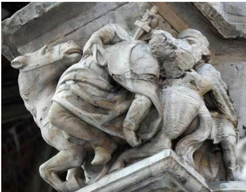
Kapiteel boven de Leeuwentrap van het Brusselse stadhuis, met afbeelding van de aanslag op Everard T'Serclaes.