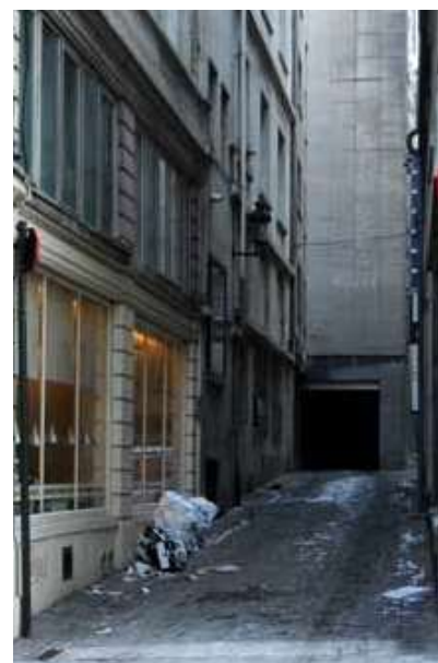
De T'Serclaesstraat, een groezelige steeg in hartje Brussel.