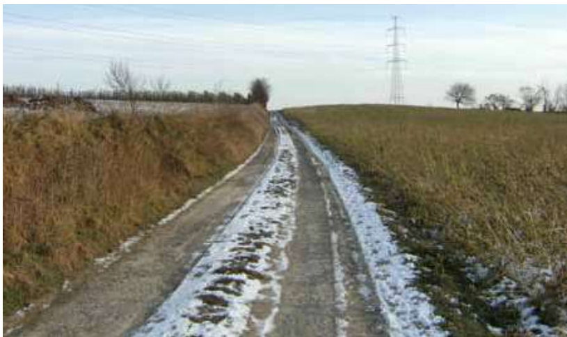
De landelijke Kwadewegenstraat op de grens van Lennik en Vlezenbeek, plaats-delict van de aanslag op T'Serclaes volgens de negentiende-eeuwse overlevering.

Men heeft zich ook gebogen over de plaats waar de aanslag op T'Serclaes precies plaatsvond. Zo wordt vaak beweerd dat de naam van de Kwadewegenstraat, op de grens van Sint-Martens-Lennik en Vlezenbeek, herinnert aan de aanslag. 34 De landelijke Kwadewegenstraat is een zijstraat van de Lenniksebaan, die Lennik met Brussel verbond (en verbindt). T'Serclaes kan er in 1388 dus effectief gepasseerd zijn. Etymologisch gezien houdt het echter geen steek om Kwadewegen – voor het eerst geattesteerd in 1609 35 – te verbinden met de aanslag op T'Serclaes. Er bestaan in Vlaanderen immers wel meerdere Kwadewegen en Kwadestraten . Het toponymisch bestanddeel 'kwaad' wijst daarbij op de slechte, erbarmelijke of moeilijk begaanbare staat van de weg (en niet op een 'kwade' gebeurtenis). 36