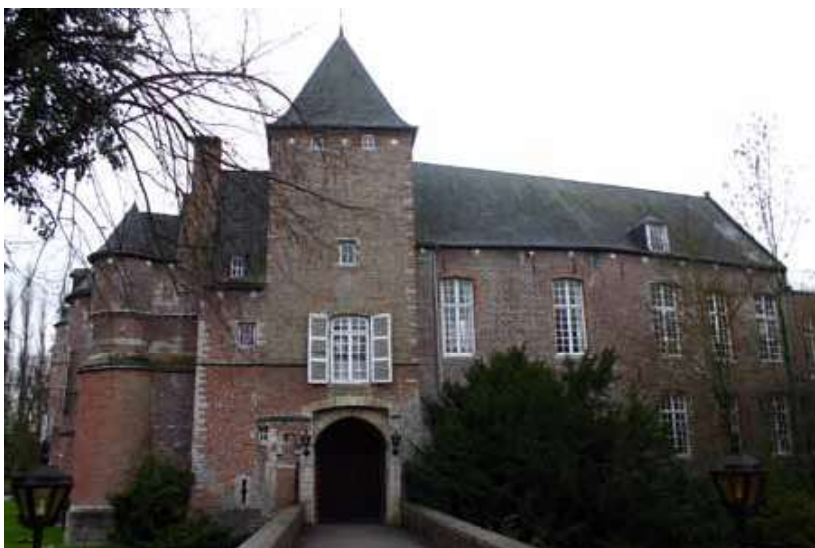
Het kasteel van Kruikenburg in Ternat. Het kasteel werd in de zeventiende eeuw herbouwd in classicistische stijl en voorzien van een lange dreef. In de negentiende eeuw werd een landschapspark aangelegd.

Over Everard T'Serclaes' bezittingen is heel wat minder bekend. Monteyne stelde dat T'Serclaes van jongs af bijzonder rijk was, maar volgens Clement is het moeilijk om uit te maken hoe hij zijn bezittingen precies heeft verworven. 7 Een belangrijke uitbreiding van zijn patrimonium gebeurde in 1381, toen de heer van Wezemaal hem een reeks bezittingen verkocht, met als belangrijkste goed het kasteel en de heerlijkheid Kruikenburg (waarvan Ternat, Sint-Katharina-Lombeek en Wambeek deel uitmaakten).