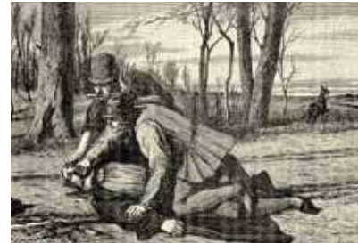
De aanslag op Everard T'Serclaes volgens een negentiende-eeuwse interpretatie (overgenomen uit Excursions et promenades , Bruxelles, s.d., p. 20).