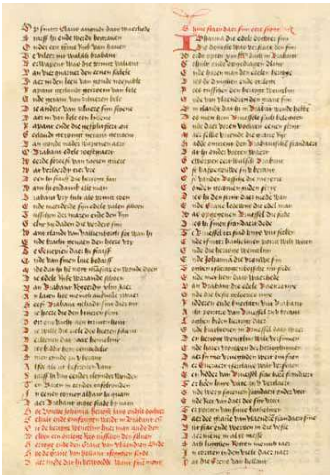
Passage uit de kroniek van Hennen van Merchtenen: in de rechterkolom wordt verteld hoe Everard T'Serclaes de vlag van de Vlaamse graaf neerhaalt en in de gracht werpt (© Erfgoedbibliotheek Hendrik Conscience, Antwerpen, cat.nr. B 15828, fol. 106v).