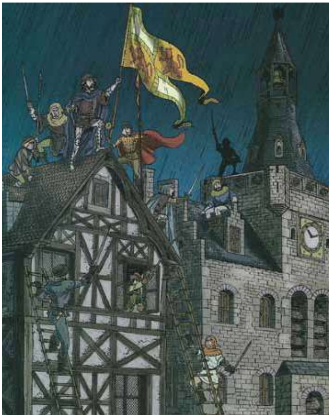
Vaak wordt verkeerd verteld en getoond dat Everard T'Serclaes en zijn getrouwen de Vlaamse vlag van het huis de Ster haalden (terwijl ze op het stadhuis wapperde), zo ook in de recente strip Brussel van N. Van de Walle en J. Martin (© N. Van de Walle en J. Martin – Casterman).