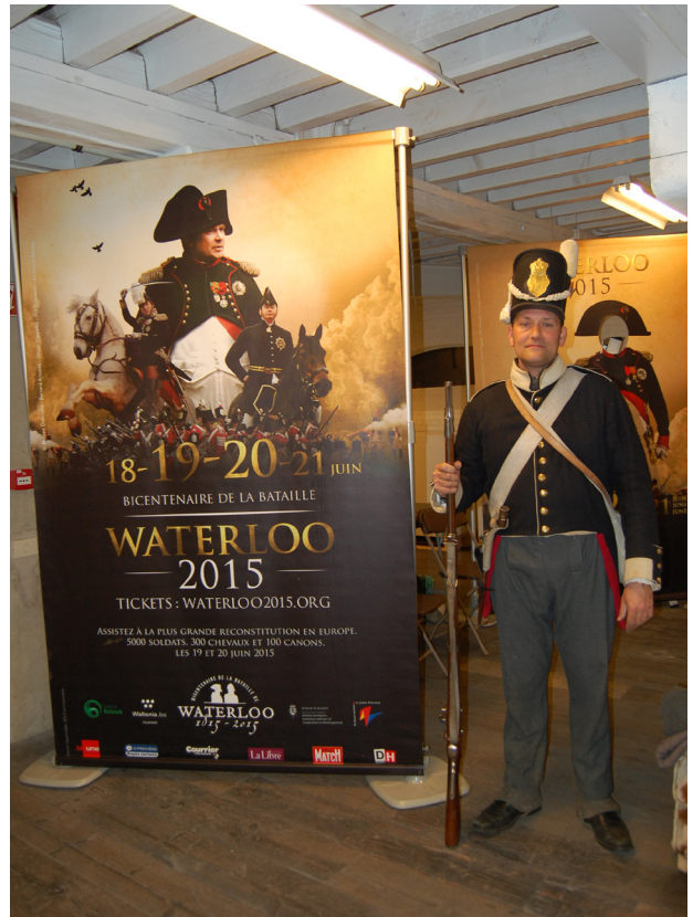
Tijdens het congres 2015 van Familiekunde Vlaanderen in het FelixArchief te Antwerpen werden bezoekers verwelkomd door een soldaat uit het leger van Napoleon. Op deze wijze werd de aandacht gevestigd op de herdenking van de Slag bij Waterloo.