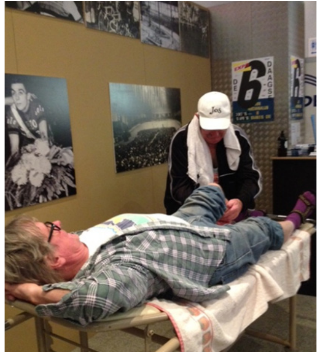
Bezoekers aan de zesdaagse op bezoek konden zich op bepaalde momenten ook laten masseren.

Het Huis van Alijn op bezoek neemt zijn intrek in woonzorgcentra, waarbij een tentoonstelling en acties voor bewoners, buurtbewoners, familie en lokale verenigingen en scholen worden opgezet. Bij DE ZESDAAGSE OP BEZOEK trok de aanval op het werelduurrecord veel deelnemers en pers aandacht.