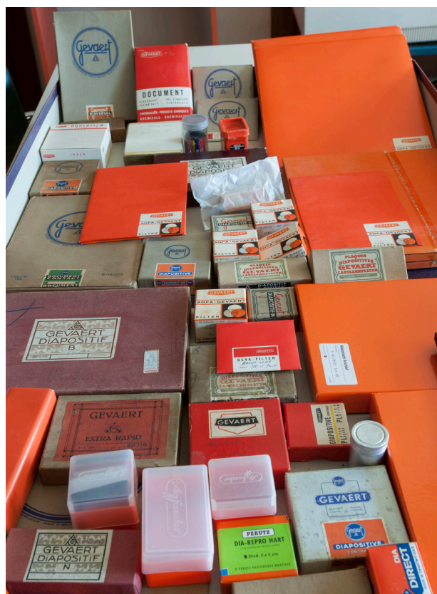
Deelcollectie verpakkingen Gevaert-archief, 2017.