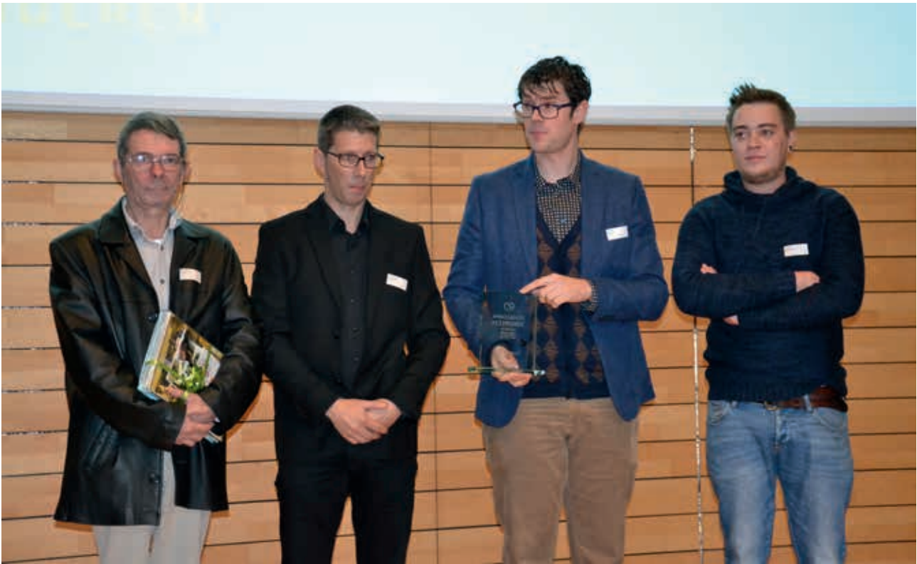
Erfgoed Balen houdt er een sterke vrijwilligerswerking op na en slaagt er in om ook jongeren te betrekken. Hierdoor sleepte Erfgoed Balen in 2015 nog de titel Ambassadeur Heemkunde Vandaag in de wacht.

bestuur en de tijdelijke commissies duidelijk zijn. Als de erfgoedraad deel uitmaakt van de cultuurraad is het ook belangrijk om de relaties met de cultuurraad helder te stellen. Voor welke zaken kan de erfgoedraad zelf beslissingen nemen en welke punten moet je nog voorleggen aan de cultuurraad?