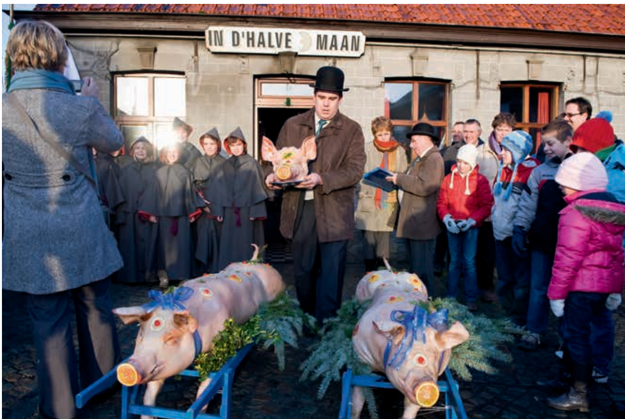
Sint-Antoniusviering in Ingoogem, 2010

In Vlaanderen wordt in verschillende gemeenten een Sint-Antoniusviering georganiseerd. Tussen de vieringen bestaan zowel verschillen als gelijkenissen.