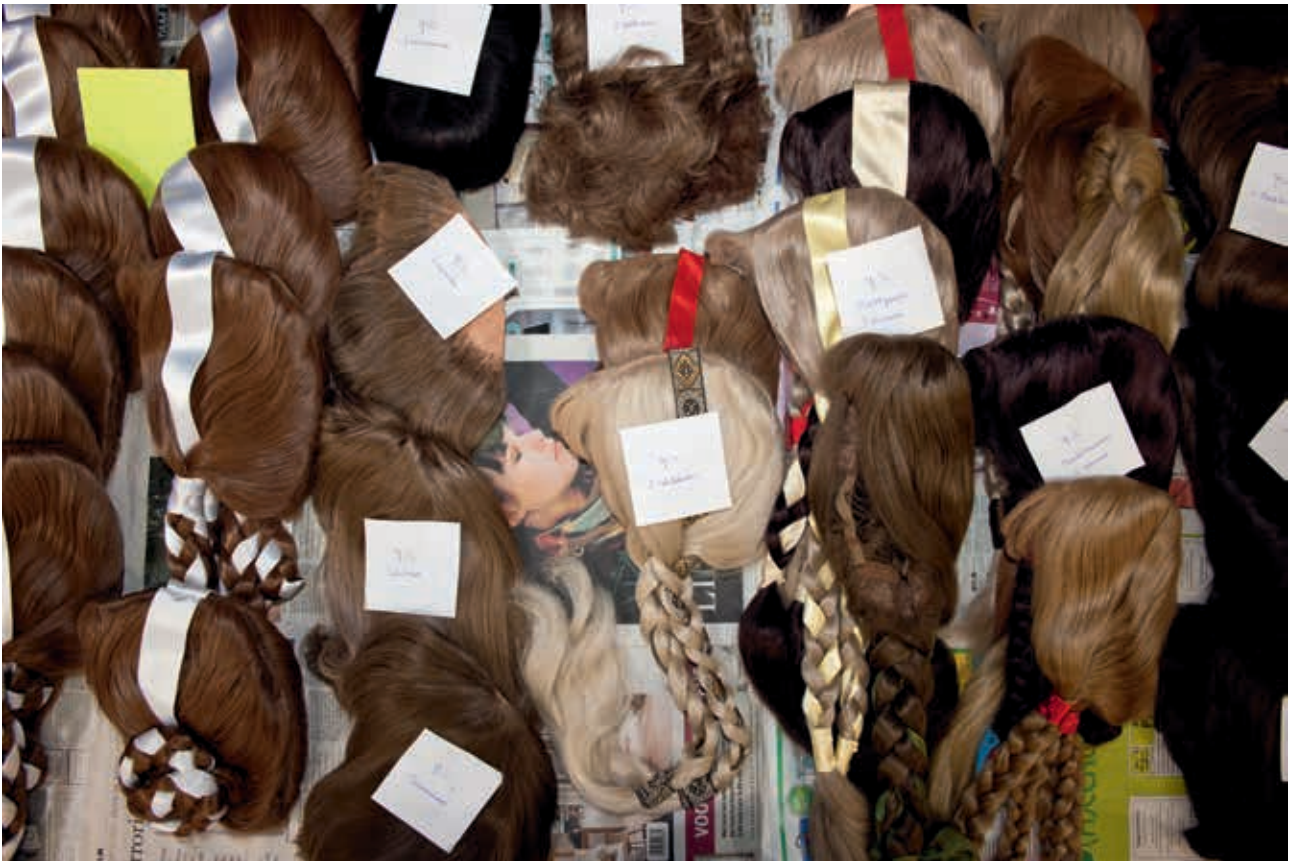
Heilig Bloedprocessie in Brugge, 2010

Aan feesten en vieringen zijn tal van voorwerpen en documenten verbonden. Met het oog op een duurzame toekomst moet ook hier doordacht mee omgegaan worden.