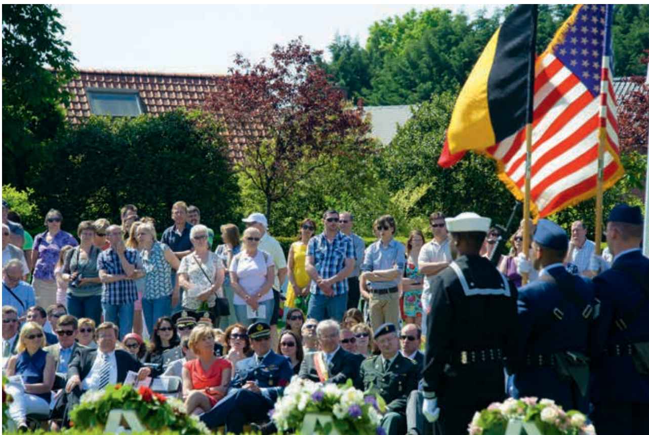
Memorial Day op het Flanders Field American Cemetery in Waregem

De Memorial Day-viering in Waregem is rechtstreeks gelinkt aan Flanders Field, de Amerikaanse begraafplaats in de gemeente.