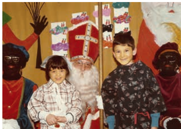
Sinterklaasviering in Neerpelt, 1987 Feestelijk erfgoed is dynamisch. Het Sinterklaasfeest is de voorbije decennia van onderuit geëvolueerd.

De veranderingen in kwestie kunnen op de inhoud of betekenis van een feestelijke gebeurtenis betrekking hebben. Het Sinterklaasfeest is bijvoorbeeld duidelijk van onderuit geëvolueerd. Op tal van plaatsen is het kruis op de mijter van de Sint intussen vervangen door een hoofdletter S. Ook de rol van Zwarte Piet is vandaag anders dan pakweg veertig jaar geleden. Zo evolueerde Zwarte Piet in de ogen van de kinderen van een boeman naar een goedlachse, speelse figuur.