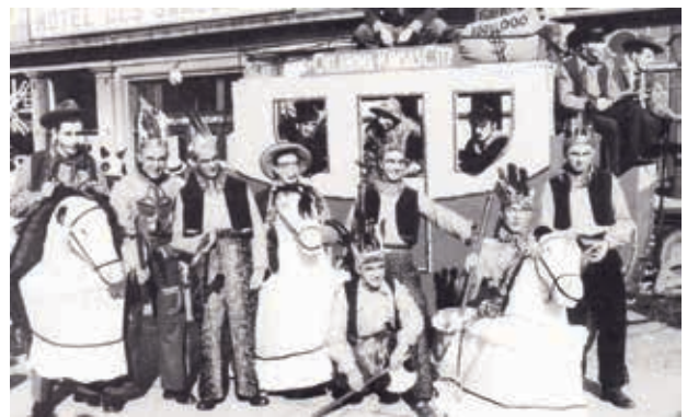
Carnaval in Blankenberge, 1953

verschillende erfgoedgemeenschappen die bij elk van deze elementen betrokken zijn, een geïnspireerd en onderbouwd erfgoedzorgplan uitgewerkt. In een aantal gevallen hebben ook heemkundigen hun schouders gezet onder het voorbereiden, opstellen en uitwerken daarvan. Zo speelden de vrijwilligers van het Stedelijk Heemkundig Centrum De Benne in Blankenberge een belangrijke rol in het dossier van de gemeentelijke carnavalsviering. Zij verzamelden archiefstukken over het carnaval, zoals foto's, persartikels, medailles, carnavalsafiches, enzovoort, en inventariseerden die. Aan de hand daarvan werden vervolgens enkele thematische tentoonstellingen opgezet en diverse online columns gepubliceerd.