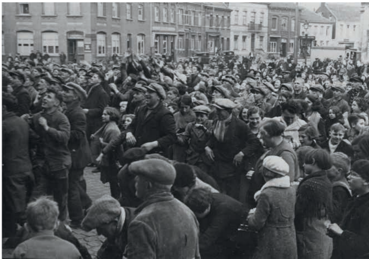
Het publiek bij de worp der apostelbrokken in Rupelmonde, 1936 Of een traditie gevrijwaard wordt voor de toekomst, hangt af van hoe er vandaag mee omgegaan wordt. De traditiedragers zelf staan immers in voor de overdracht.

Een standaardaanpak om tradities door te geven bestaat niet, want dat werkt niet in de praktijk. Een generaliserende aanpak zou immers voorbijgaan aan de eigenheid die een traditie typeert. Voor feestelijkheden geldt dat eens te meer. Elk feest of