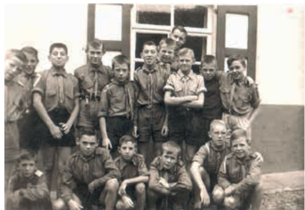
Het eerste kamp te Gavere in '64

Zonder hulp zouden we het met ons twee niet gereed hebben. Dus zochten we partners om mee samen te werken.