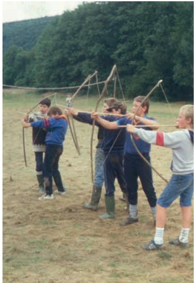
Boogschieten te Masbourg (1987)

Of toch niet helemaal, want er moesten zeker nog enkele zaken gebeuren. Het evaluatiedossier van de erfgoedcel moest nog binnen. Dit was nodig om een tweede schijf subsidies uitgekeerd te krijgen. Ook de naverkoop moest nog geregeld worden, want wat gebeurt er anders met de overschot van onze boeken? Via een formulier op de website van de jeugdbeweging kan je zolang de voorraad strekt de publicatie nog aankopen. We beseffen dat we hierover blijvend promotie zullen moeten maken, tot alle boeken weg zijn. Op toekomstige activiteiten van de KSA zullen we dus zeker opnieuw met een beperkt verkoopsstandje uitpakken.