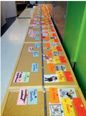
Een lange tijdlijn op verschillende prik-borden. Iedereen vult aan!

Dit werd dus al een eerste publieksmoment, maar het was voor ons bovenal het uitgelezen moment om informatie te vergaren. Door iedereen samen te hebben, en de koppen bijeen te steken, werden er veel gaten in onze tijdlijn gedicht.