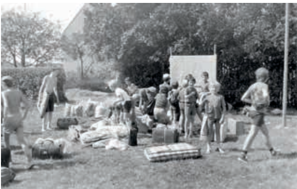
Aankomst op kamp.