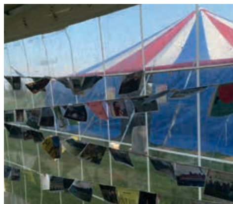
Op het feestweekend.