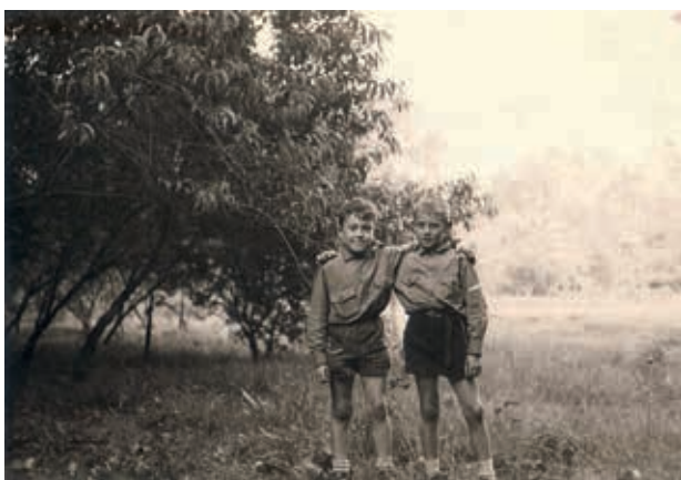
KSA'ers in uniform (1965)

Onderschat het werk en de moeite die je in dit project gaat steken zeker niet. Denk goed na wat je wilt verwezenlijken, en durf je doelen bij te stellen. De tentoonstelling die we uiteindelijk opstelden was veel beperkter dan we op voorhand voor ogen hadden. Maar het effect bleef wel hetzelfde: de oude foto's leverden verbaasde blikken en vergeeten verhalen op. Ook een kleine actie rond de eigen historiek kan al heel wat reacties losweken. Onze prikborden-tijdlijn – hoe simpel ook – kon niemand passeren zonder er toch eens een blik op geworpen te hebben. Over een simpele powerpoint met wat oude foto's wordt er weken later nog gepraat. Hou het dus gerust simpel, en doe enkel wat je ziet zitten.