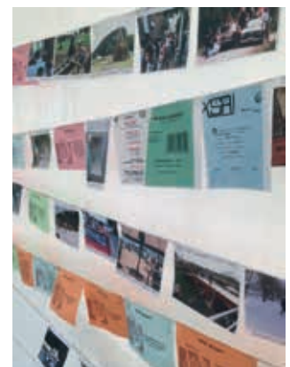
Kleurrijke foto's en scans van oude documenten aan een sjortouw.