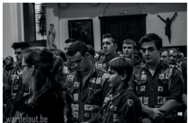
Misviering voor het 50-jarige jubileum (2014)

De KSA-leiding organiseerde, om het jubeljaar in gang te trekken, een receptie voor alle verenigingen van Herdersem met aansluitend een etentje voor alle oud-leiders. Voor ons werd dit een uitgelezen kans om info te vergaren en de beperkte kennis bij te sturen en aan te vullen. Om dit op een speelse wijze aan de man te brengen, hadden we een tijdslijn gemaakt waar oud-leiders zelf info konden aan toevoegen of gebeurtenissen wisselen van jaar als wij deze aan een verkeerd jaar koppelden. Tevens hadden we een selectie gemaakt van foto's om als diavoorstelling tijdens het etentje te projecteren.