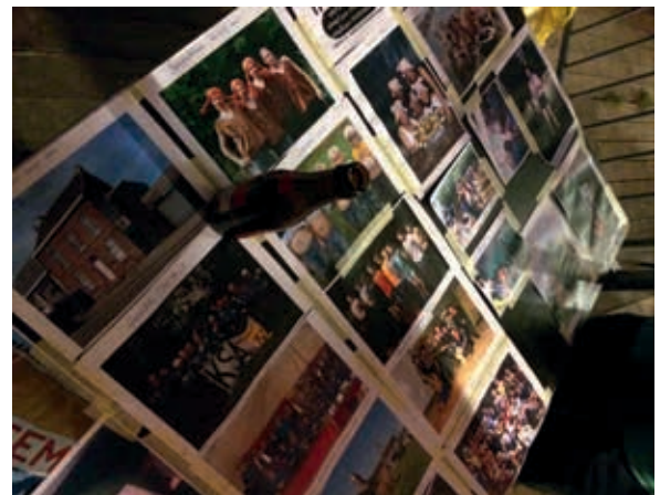
Ook de verkoopsstand werd ingekleed.