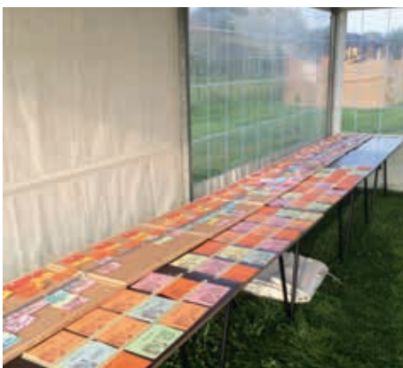
Tijdlijn en wist-je-datjes.