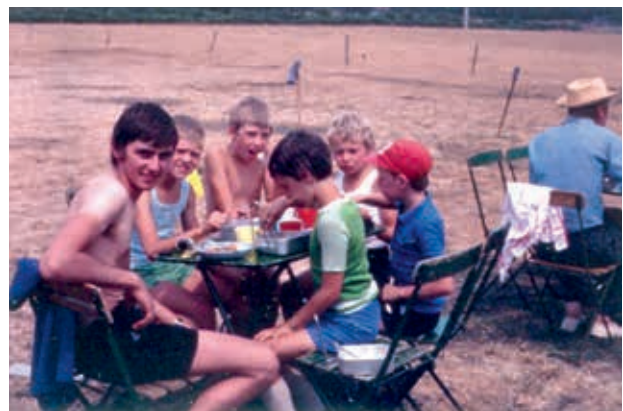
Samen eten op kamp te Zelem (1976)

Zoals de meeste erfgoedprojecten begon ook dit traject met het in kaart brengen van de beschikbare bronnen en het verzamelen van de nodige informatie.