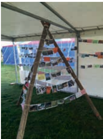
Een driepikkel vol foto's: helemaal KSA!

De voorstelling van het boek aan het grote publiek gebeurde op het feestweekend in september. Tegen dat weekend waren we al meer dan een jaar aan dit project aan het werken. Het feestweekend, tevens het slotweekend van het vijftigste werkjaar, was dus de ideale gelegenheid om ons boek te verkopen.