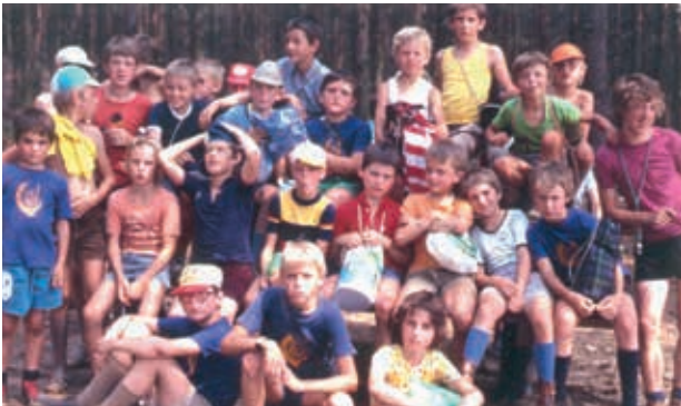
Groepsfoto te Zelem (1976)

Hierdoor kwamen we al snel tot de conclusie dat het KSA-archief niet onze enige bron kon zijn. We wilden ook paal en perk stellen aan dat verwaarloosde archief. Daarom richtten we ons naar alle oud-leiders.