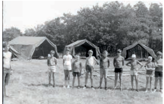
Opening op kamp.

schrijfstijl, zijn eigen schrijfritme, zijn eigen woordenschat en zijn eigen manier van doen. Gelukkig bestaan er tegenwoordig systemen zoals Dropbox of Google Drive. Dit zijn een soort van online servers of online harde schijven. Door hier op aan te melden, en je documenten hier steeds op te zetten, ben je ook zeker dat je steeds opnieuw aan de meest recente versie van een bestand aan het werken bent. Hierdoor is het makkelijk gezamenlijk te schrijven aan een tekst, zonder daar steeds voor samen te moeten zitten.