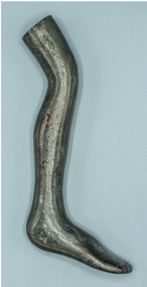
Metalen ex voto in de vorm van been. De herkomst is onbekend, maar de materie waaruit het object vervaardigd is, wijst in de richting van een Leonardushelligdom. (Privécollectie. Foto ©Patrick Palmans)