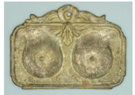
Zilveren ex voto die wijst op borstkanker. (Privécollectie.)

Professionele assistentie is aangewezen bij het bewaren van dit soort werken omdat ze zo delicaat zijn. Het is mogelijk dat er schimmels op of insecten (houtworm en zilversjes) in het werk zitten. Het kan zijn dat het doek verkeerd is opgespannen, of dat er schadelijke retouches zijn gebeurd in het verleden, of dat het werk ooit verkeerd gereinigd is ... Allemaal delicate aspecten die om professioneel advies vragen.