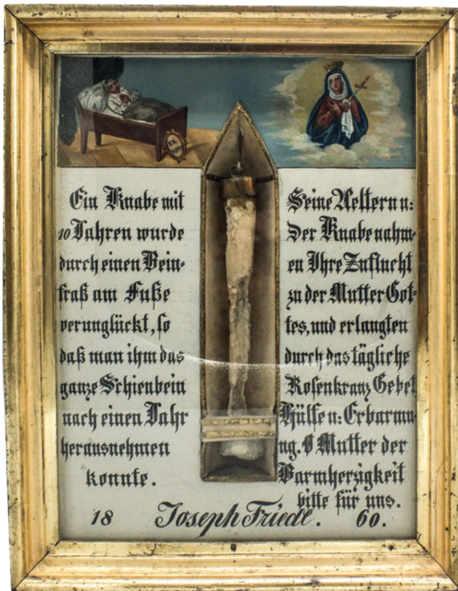
Ex votoschilderij. De ex voto bevat een afbeelding van de zieke, het genadebeeld alsook het aangetaste bot. (Privécollectie.)