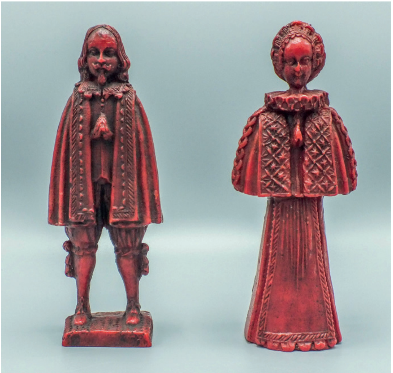
Figuren uit rode was. De schenkers schenken portretten van zichzelf aan de heilige. Dit soort ex voto's werden op maat gemaakt en waren enkel toegankelijk voor de rijke burgerij en de adel. Dit is een afgietsel van een zeventiende-eeuwse mal uit Beieren. (Privécollectie. Foto ©Patrick Palmans)