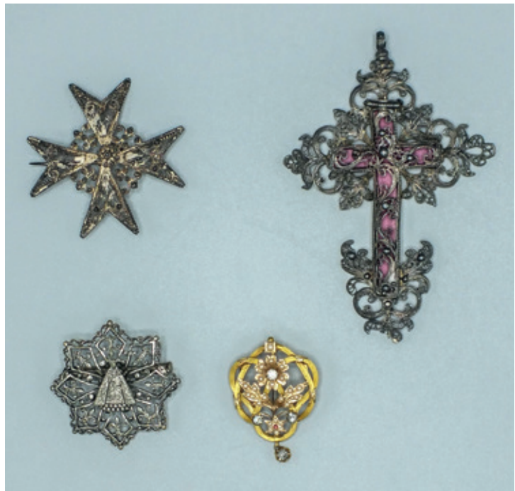
Beter begoede mensen konden juwelen als ex voto's aan een genadebeeld schenken. De juwelen werden aan het beeld gehangen of op de mantel van het beeld gespeld. (Privécollectie. Foto ©Patrick Palmans)

zo een votiefschilderij met tekst hangt in de kapel van Onze-Lieve-Vrouw van Zeven Weeën in het Limburgse Vreeren. Pittoresk is de verzameling ex votoschilderijen in het Sint-Eucheruskapelletje van Brustem.