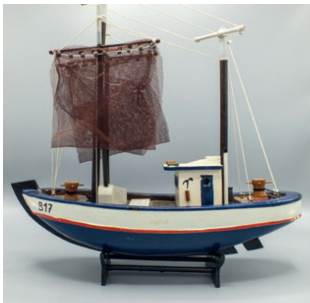
Replica van een ex-votootje uit Bredene. (Privécollectie.)

Het hoeft geen betoog dat dit gebruik enkel in zwang is bij vissers en schippers en hoofdzakelijk in kustgebieden. Ze worden geofferd uit dank voor het overleven van een storm of een gevaarlijke vaart. Ze kunnen natuurlijk ook geschonken worden om een behouden vaart of bescherming van de bemanning af te smeken. In Vlaanderen zijn de bootjes doorgaans van hout en beschilderd. Ze dragen het bootnummer.