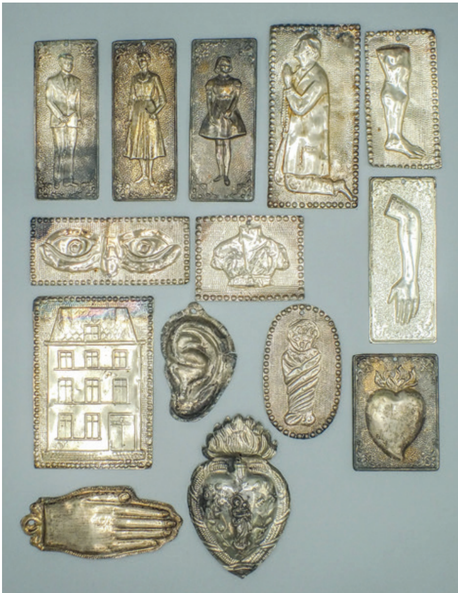
Verschillende zilveren ex voto's van diverse herkomst en uit een periode van 1860 tot 1940. (Privécollectie.)