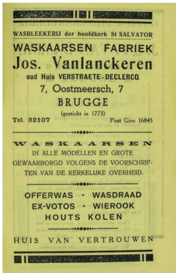
Reclame voor een fabrikant van onder meer ex voto's in het Bisdomeboek van Brugge uit 1948. (Privécollectie. Foto ©Patrick Palmans)