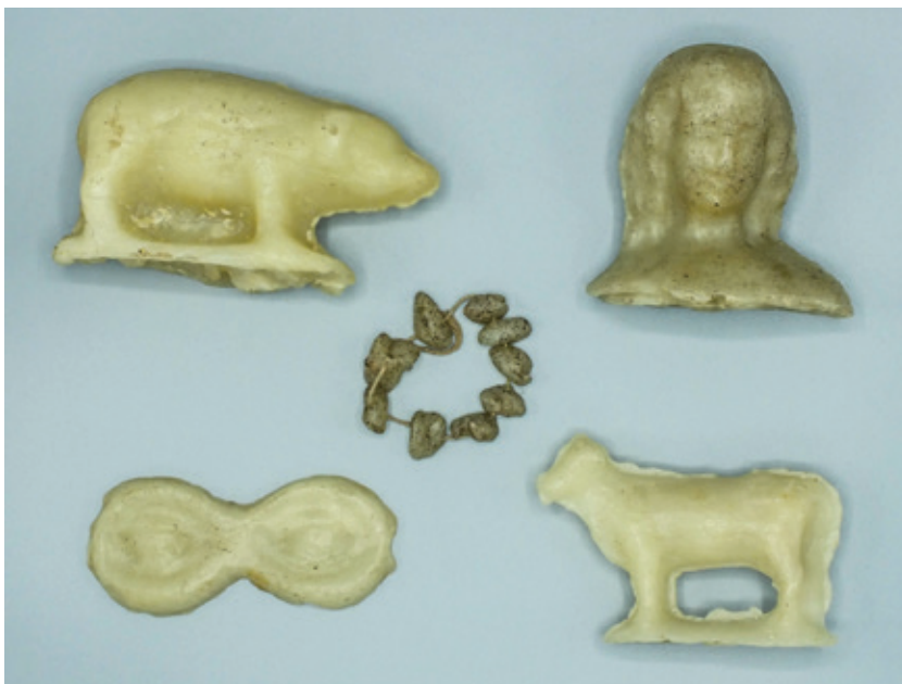
Wassen ex voto's die tot in de jaren 1980 gebruikt werden in de Allerheiligenkapel van Diest. (Privécollectie. Foto ©Patrick Palmans)

17 Voor dit onderdeelje bewaring heb ik dankbaar gebruik gemaakt van tips van Phaedra Bosmans, depotbeheerder van het CRKC (Heverlee). Meer tips voor de bewaring van allerhande erfgoeddragers vindt men op www.depotwijzer.be .