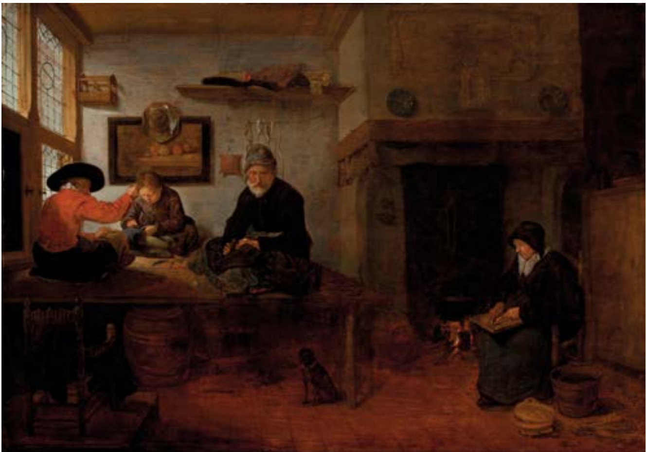
Quirijn van Brekelenam, werkwinkel van een kleermaker, ca. 1653, Worcester Art Museum, Verenigde Staten.