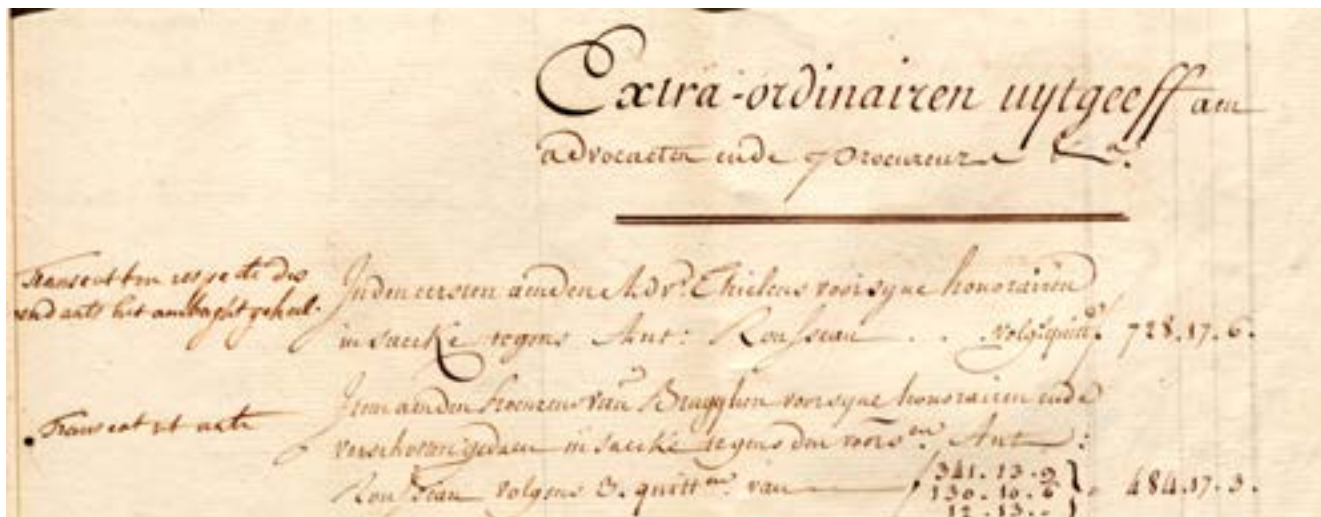
Uitgaven aan proceskosten tegen Antoine Rousseau, rekeningboek kleermakersambacht, 1783–1784, Rijksarchief Brussel, Ambachten, 873.

Het moet een echte financiële adering zijn geweest voor het ambacht. Antoine Rousseau kon dus zonder beperkingen op het aantal knechten blijven functioneren. Lang kon hij niet profiteren van deze maatregel, want in januari 1785 overlijdt hij. In zijn overlijdensakte wordt hij beschreven als 'maitre fabricant de bas de chausses' , wat suggereert dat hij dan ook kousen maakte, niet enkel korsetten. 36