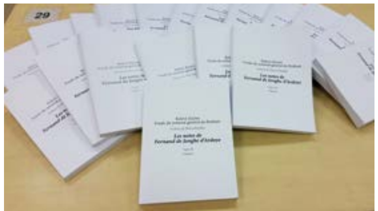
De Nota's de Jonghe d'Ardoye, toegang op ca. 73.000 akten uit het Notariaat van Brussel, doorzoekbaar op naam, 11 delen, 19 volumes, beschikbaar in de leeszaal in het Rijksarchief Brussel (kopieën). De originele nota's bevinden zich in de Office Généalogique et Héraldique de Belgique.