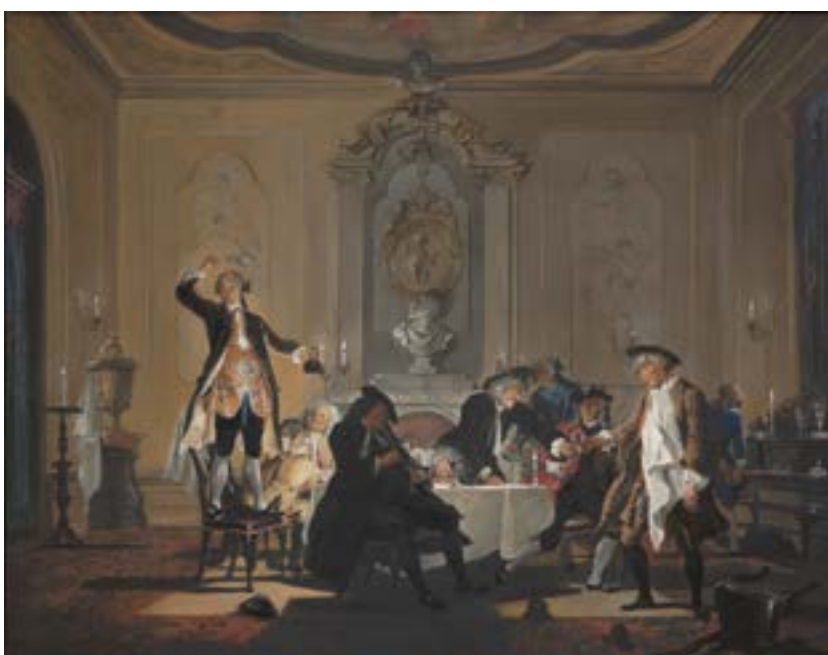
Cornelis Troost, 'Rumor erat in casa' (het werd rumoerig in huis) , ca. 1739-1740. Een gezellige avond loopt wat uit de hand. De met kandelaars rijk gevulde tafel trekt alle aandacht naar zich toe – een mooi voorbeeld van het belang van licht bij rituelen van laatavond sociabiliteit. Mauritshuis, Den Haag.