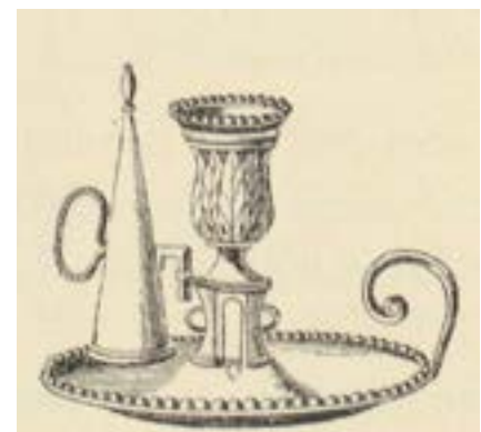
Handblaker met domper. Henry-René d'Allemagne, Histoire du luminaire depuis l'époque romaine jusqu'au XIXe siècle (Parijs 1896), 339.

Olielampen als deze konden worden opgehangen aan de haardbalk, het plafond, een wand of een standaard. Op die manier konden ze gemakkelijk worden gezet daar waar er viel bij te lichten. Weyns, Volkshuisraad in Vlaanderen: naam, vorm, geschiedenis, gebruik en volkskundig belang der huiselijke voorwerpen in het Vlaamse land van de middeleeuwen tot de eerste wereldoorlog (Beerzel 1974), 728-730.