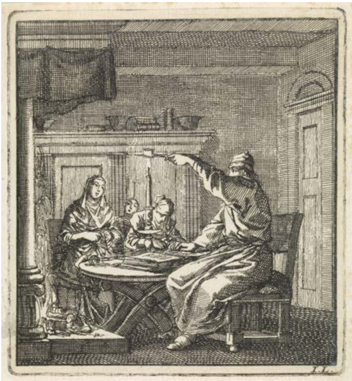
Jan Luyken, Het leerzaam huisraad, De kaarssnuiter , 1711. Een kaarssnuiter was een soort schaar waarmee het lemmet van een kaars werd ingekort om het walmen van de vlam te voorkomen.