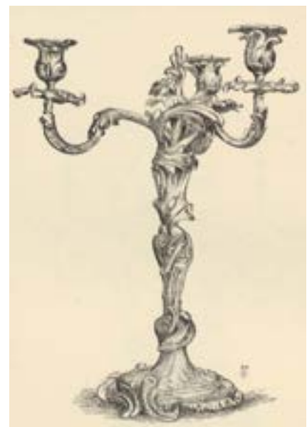
Girandole met drie armen. Henry-René d'Allemagne, Histoire du luminaire depuis l'époque romaine jusqu'au XIX e siècle (Parijs 1896), 368.