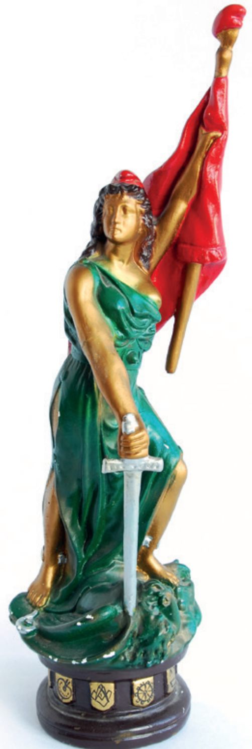
Beeld van de Marianne, met rode vlag, Frygische muts en zwaard.