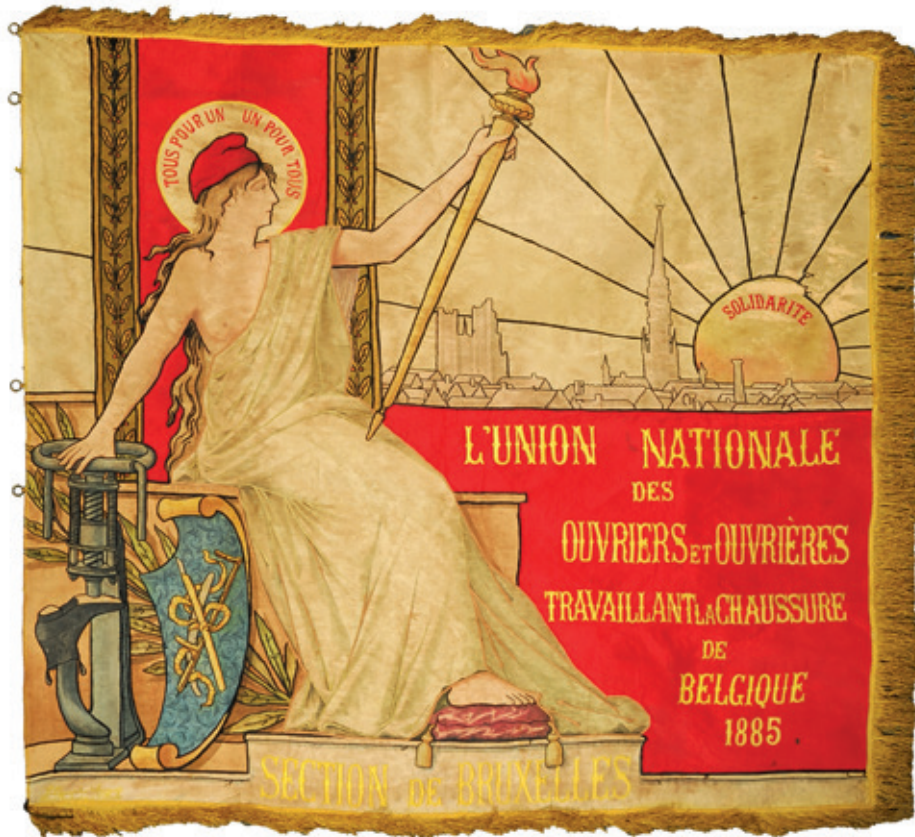
Vlag van de afdeling Brussel van de Union Nationale des Ouvriers et Ouvrières Travaillant la Chaussure de Belgique van 1885.