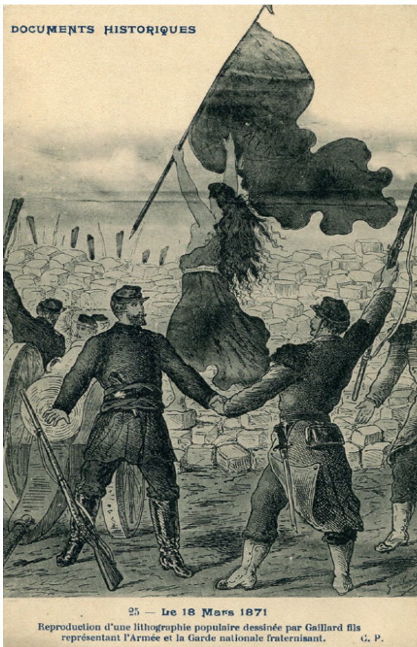
Prentbriefkaart in zwart-wit: het leger en de nationale garde verbreederen tijdens de Commune van Parijs.

een Akense lakenweverij het werk neer tegen de boetes die zij kregen van hun werkgever en voor betere arbeidsomstandigheden. Het oproer werd al gauw neergeslagen. Volgens historici was dit oproer de eerste gelegenheid waarbij Duitse arbeiders een rode vlag meedroegen als symbool voor hun verzet. Later zag men de vlag ook terug ten tijde van de weversopstand van 1844 in Sleeswijk. En uiteraard wapperde de rode vlag ook in Duitsland in het revolutiejaar 1848. Voor de arbeiders die aan deze hoofdzakelijk burgerlijke beweging deelnamen, was de rode vlag vooral een symbool dat zij tegenover de zwart-rood-gele vlag van de toenmalige machthebbers plaatsten. In het Verenigd Koninkrijk werd de rode vlag mogelijk een eerste keer meege dragen door arbeiders tijdens de zogenaamde Merthyr Rising van 1831 in South Wales. Betogers droegen toen twee in het bloed van een