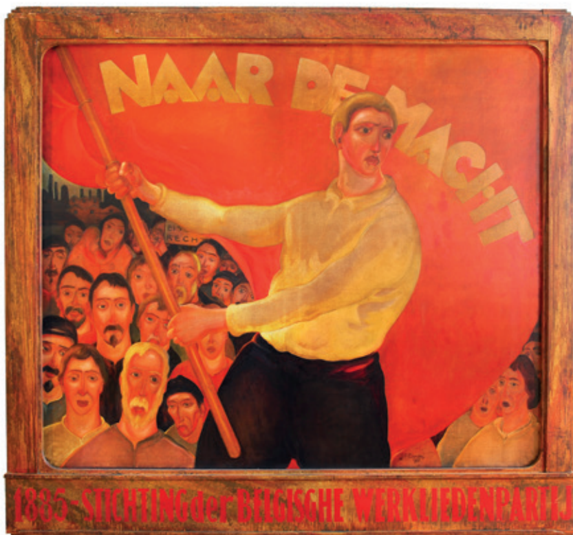
Schilderij van Jan-Frans Cantré ter herdenking van de oprichting van de Belgische Werkliedenpartij in 1885, 1931 (Amsab-ISG).