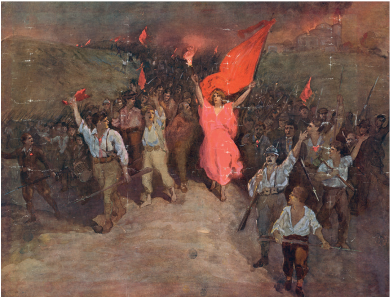
Manifestatie van arbeiders met wapens en rode vlaggen. Voorop de Marianne in rood gewaad, met rode vlag en fakkel (reproductie van een schilderij van Avanti, Amsab-ISG).

groeperingen. Men hoefde van dan af geen lid meer te zijn van zo'n groep om een bepaald beroep uit te oefenen. De wet verbood ook coalities en corporaties die de toegang tot een beroep belemmerden. In één moeite werden zo zogenaamde 'samenspanningen', zeg verenigingen van boeren en arbeiders, verboden. Die konden zich daardoor niet collectief meer verdedigen, maar moesten dat individueel doen, wat voor hen een ongelijke strijd was.