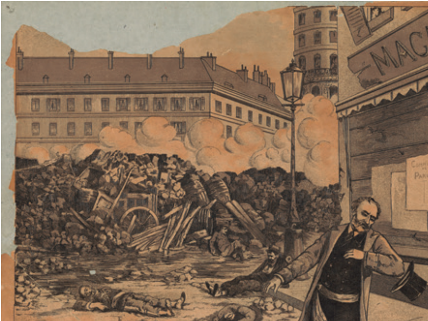
Prent met een scene uit de Parijse Commune ('Delescluze voorzag de nederlaag van Parijs').