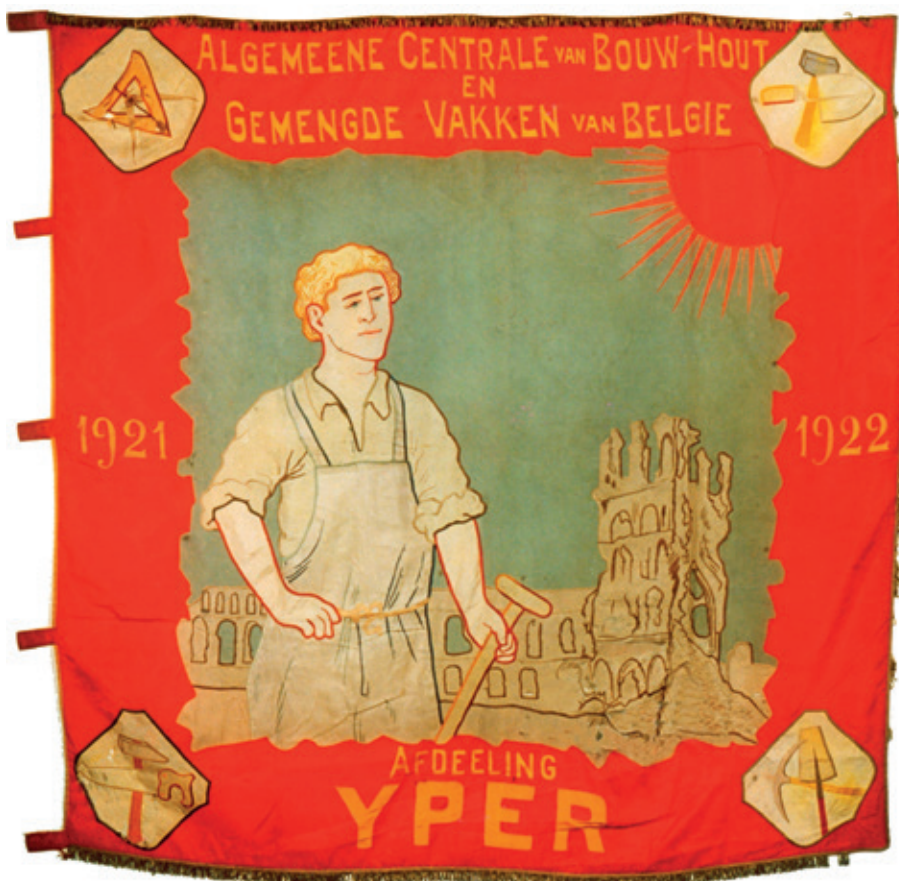
Vlag van de afdeling Ieper van de Algemeene Centrale van Bouw, Hout en Gemengde Vakken van België, 1921-1922.