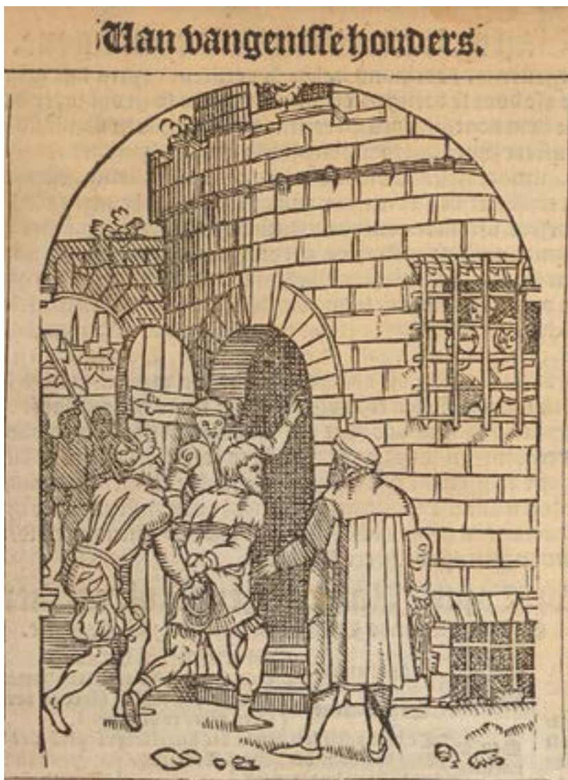
De afbeelding toont hoe iemand wordt binnengebracht in de gevangenis door de bewakers. Afbeelding uit Practijcke ende hantboek in criminele saken door Joos de Damhoudere in 1561 .