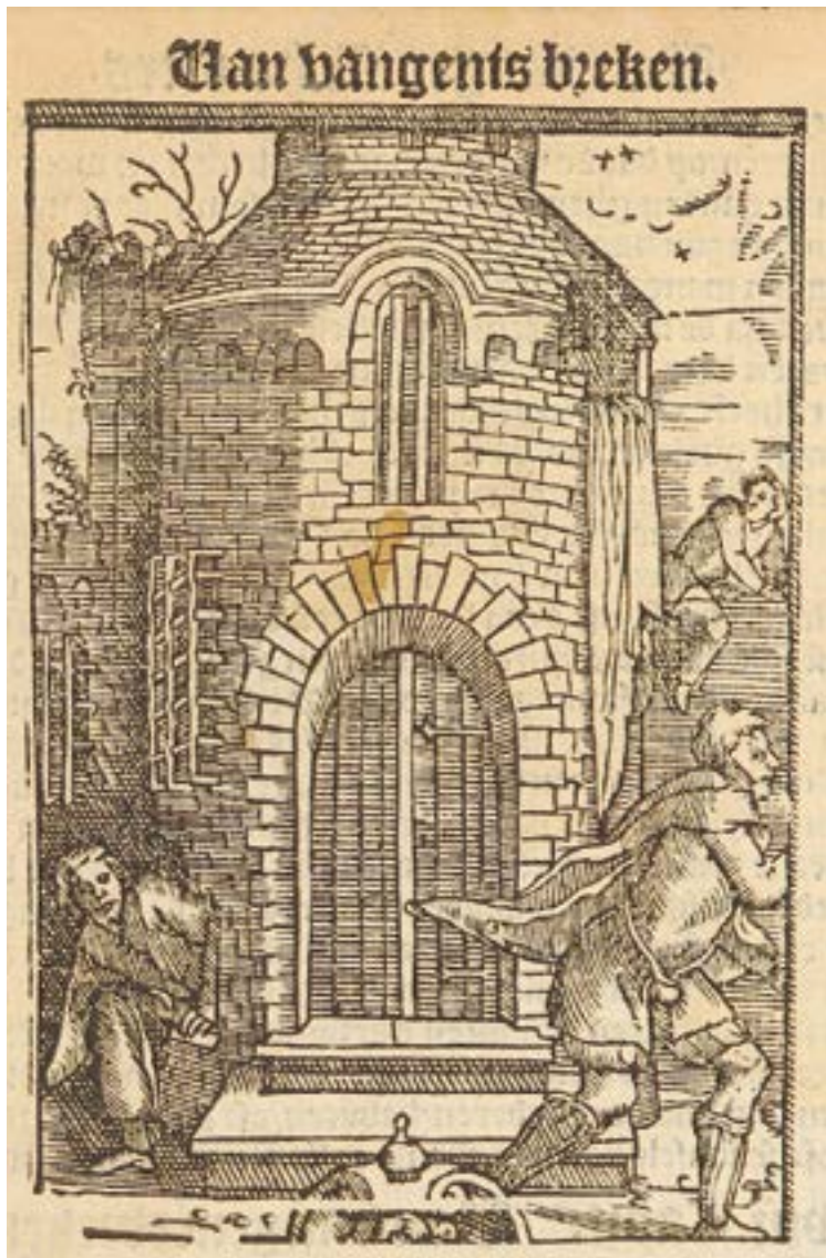
Een ontsnapping uit de gevangenis. Afbeelding uit Practijcke ende hantboek in criminele saken door Joos de Damhoudere in 1561 .