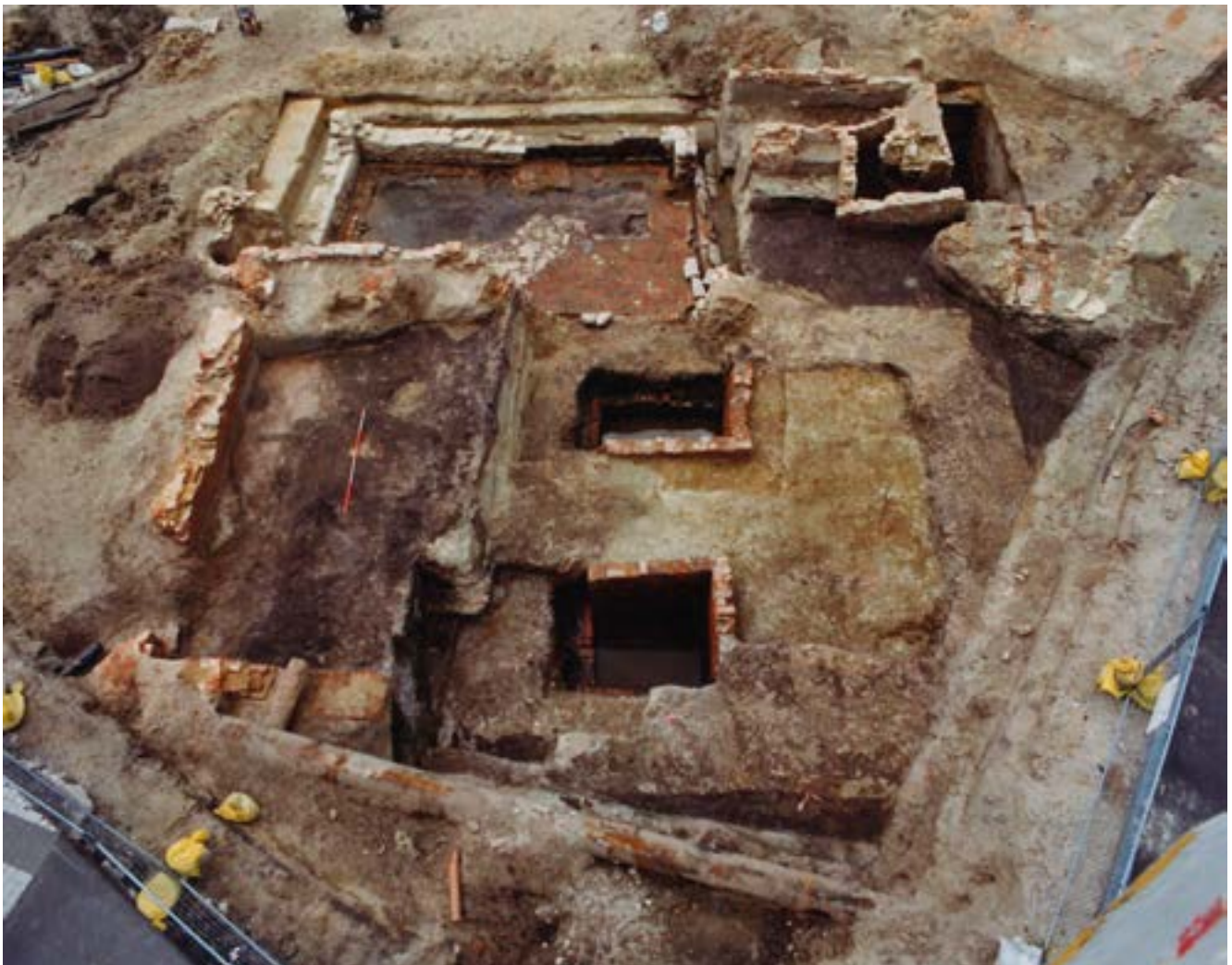
Opgravingen van het Steen in Mechelen.

Ook de eerder vermelde zestiende-eeuwse traktaten bevatten vaak afbeeldingen. De grote hoeveelheid Bijbelverhalen en apocriefe teksten waarin de gevangenis een rol heeft, zorgt eveneens voor verschillende uitbeeldingen van de gevangenis. Deze afbeeldingen geven niet zozeer een realistisch beeld, maar tonen hoe het begrip gevangenis toen werd geconcipieerd. Meer specifiek kan de gevangenis op drie verschillende manieren verbeeld worden: als plaats van opsluiting, als plaats van lijden en als plaats van liefdadigheid. 40 Bijna al deze afbeeldingen tonen een stenen gebouw, dat via een deur of ramen contact had met de wereld buiten de gevangenis.