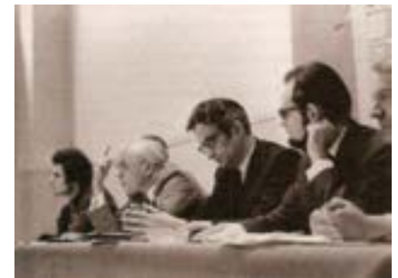
Michel Foucault (tweede van links) zijn invloedrijke werk Surveiller et punir legde de basis voor het onderzoek naar de geschiedenis van gevangenissen.