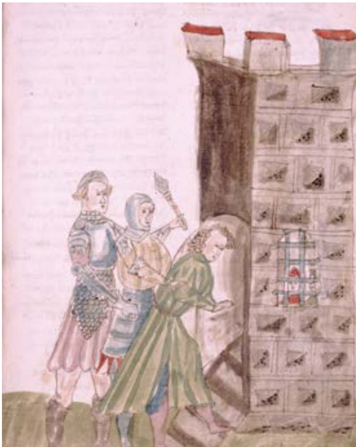
Kleurillustratie van Jozef die wordt opgesloten in de gevangenis uit de geïllustreerde bijbel van Conradus Schlapperitzi (1445).

Ook de schepenregisters in Leuven, deels gedigitaliseerd en online toegankelijk gemaakt via het project Itinera Nova bieden mogelijkheden. Vooral de vroente komt vaak ter sprake in deze registers van vrijwillige rechtspraak wanneer op verzoek van een privépersoon iemand wordt opgesloten voor schulden. Daarnaast zijn er nog meer verspreide archiefdocumenten die de moeite waard zijn, zoals het zestiende-eeuwse grondplan van het Steen in Antwerpen en de prijsberekening voor een uitbreiding van dezelfde gevangenis. 39