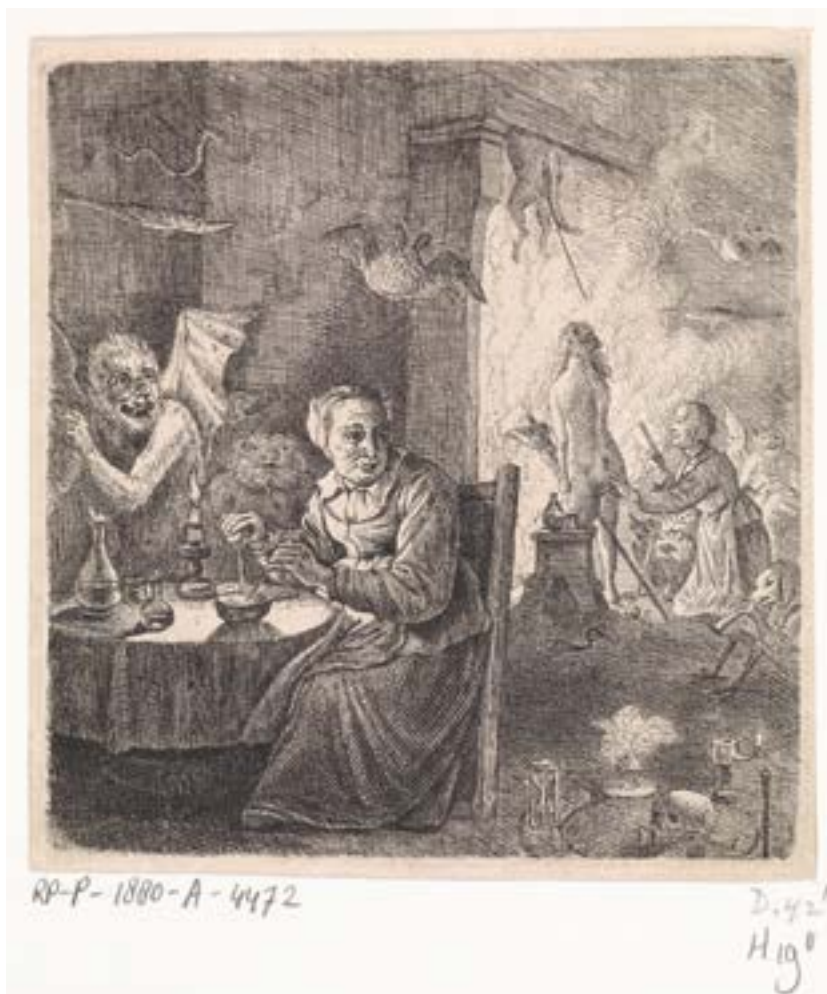
Interieur met links een heks die aan tafel een middel (vliegzaal?) bereidt. Rechts zien we nog twee heksen: een oude vrouw met een boek en een naakte vrouw met bezemsteel. Ets naar David Teniers II, 17 de eeuw. Amsterdam, Rijksmuseum, RP-P-1880-A-4472

De beschuldigten ontkenden alle aantijgingen. In vijf van de zes gevallen ging het leenhof van Laarne over tot folteringen. Daarvoor werd beroep gedaan op de Gentse beul Boudewijn Waelspeck. De tortuur begon meestal 's avonds, tussen zes en zeven uur, want dan waren de verdachten al vermoeid. De beklagden werden tijdens de – zeer suggestieve – onder- vragingen voor een hoog oplaaiend vuur gezet en moesten wakker blijven.