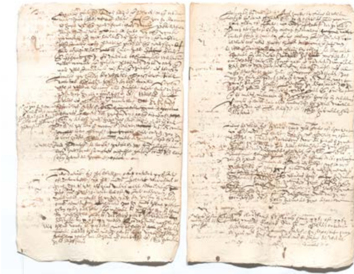
De dossiers van de heksenprocessen van Laarne zijn zo goed als integraal bewaard en bevinden zich in het Rijksarchief te Gent (AR85-nr.487).