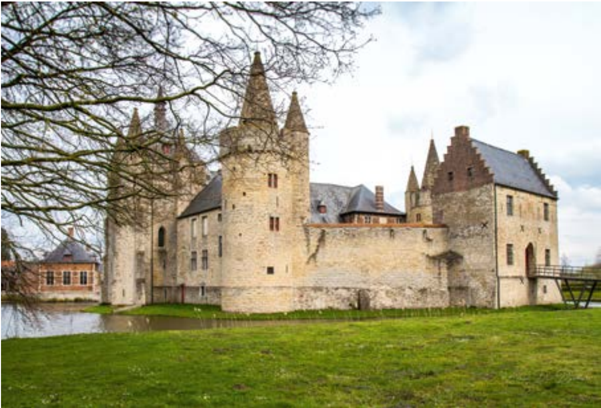
Zicht op de oudste delen van het kasteel van Laarne, met links de vierkante donjon. De gerechtszaal bevond zich op de eerste verdieping van de donjon. De beschuldigten werden in de kelder van die toren opgesloten.

Maar op de vraag of ze bezwaren had tegen de getuigen, antwoordde ze negatief en haalde zo haar verdediging onderuit. Een onderzoek van haar lichaam leverde twee duivelstekens op. Janne smeekte om genade. Het mocht niet baten. De getuigen herhaalden hun verklaringen en daarna, op 20 november, startte de ondervraging voor een groot laaiend vuur. Twaalf uur lang hield ze stand. Daarna rolden de bekentenissen er vlot uit. Ze verklikte ook andere heksen. De weg naar de brandstapel lag open. Op 2 oktober 1607 werd Janne geëxecuteerd. Haar goederen werden verbeurd verklaard.